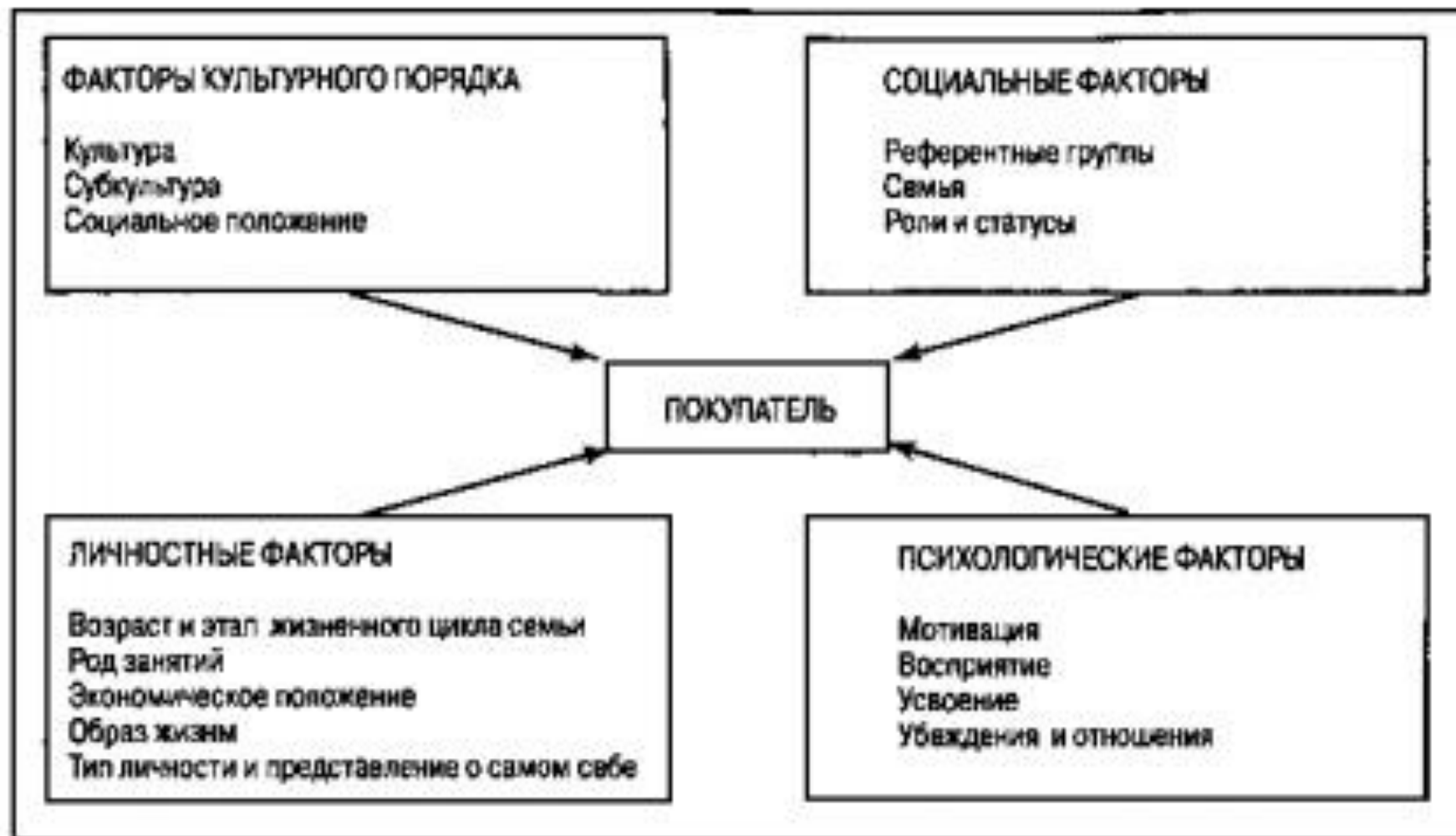
Рис. 5.3. Факторы, оказывающие влияние на покупательское поведение