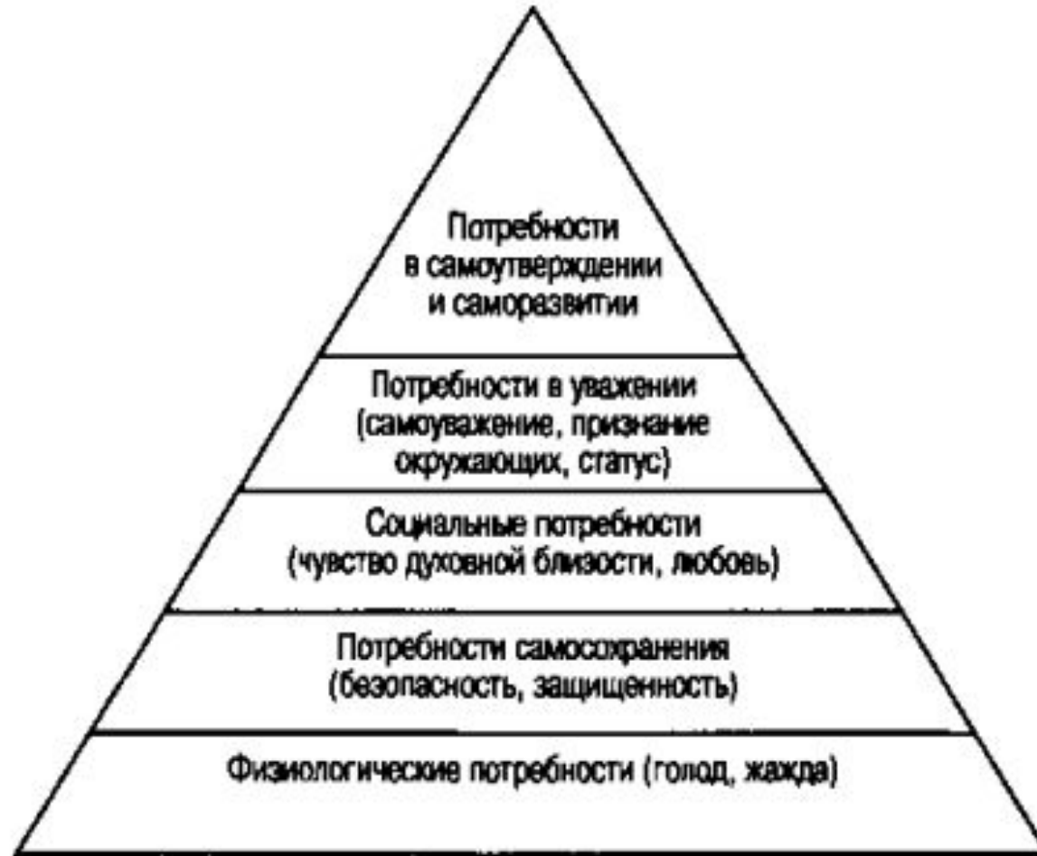
Рис. 5.4. Иерархия потребностей по Маслоу