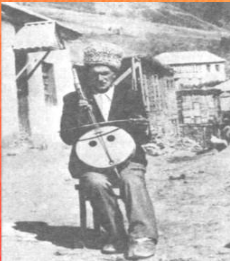
Национальный инструмент - чагана

АВАРЦЫ — самый многочисленный народ современной республики Дагестан.