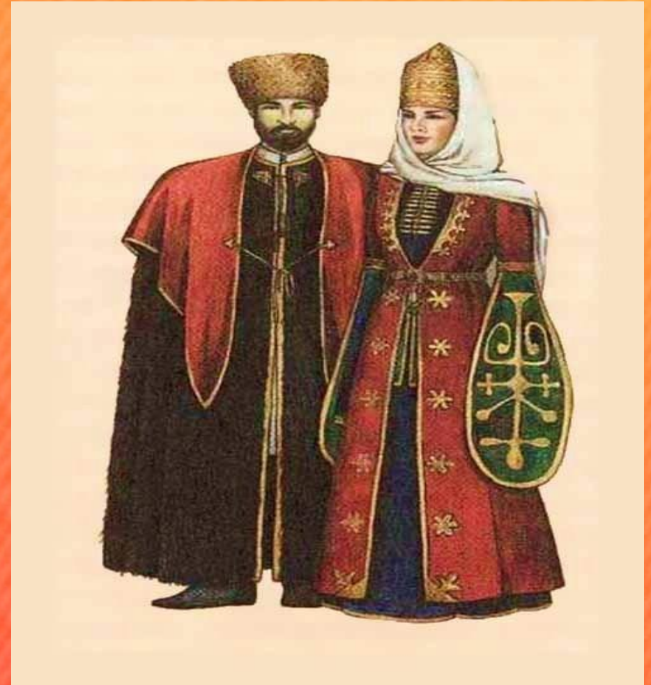
Народный костюм адыгов