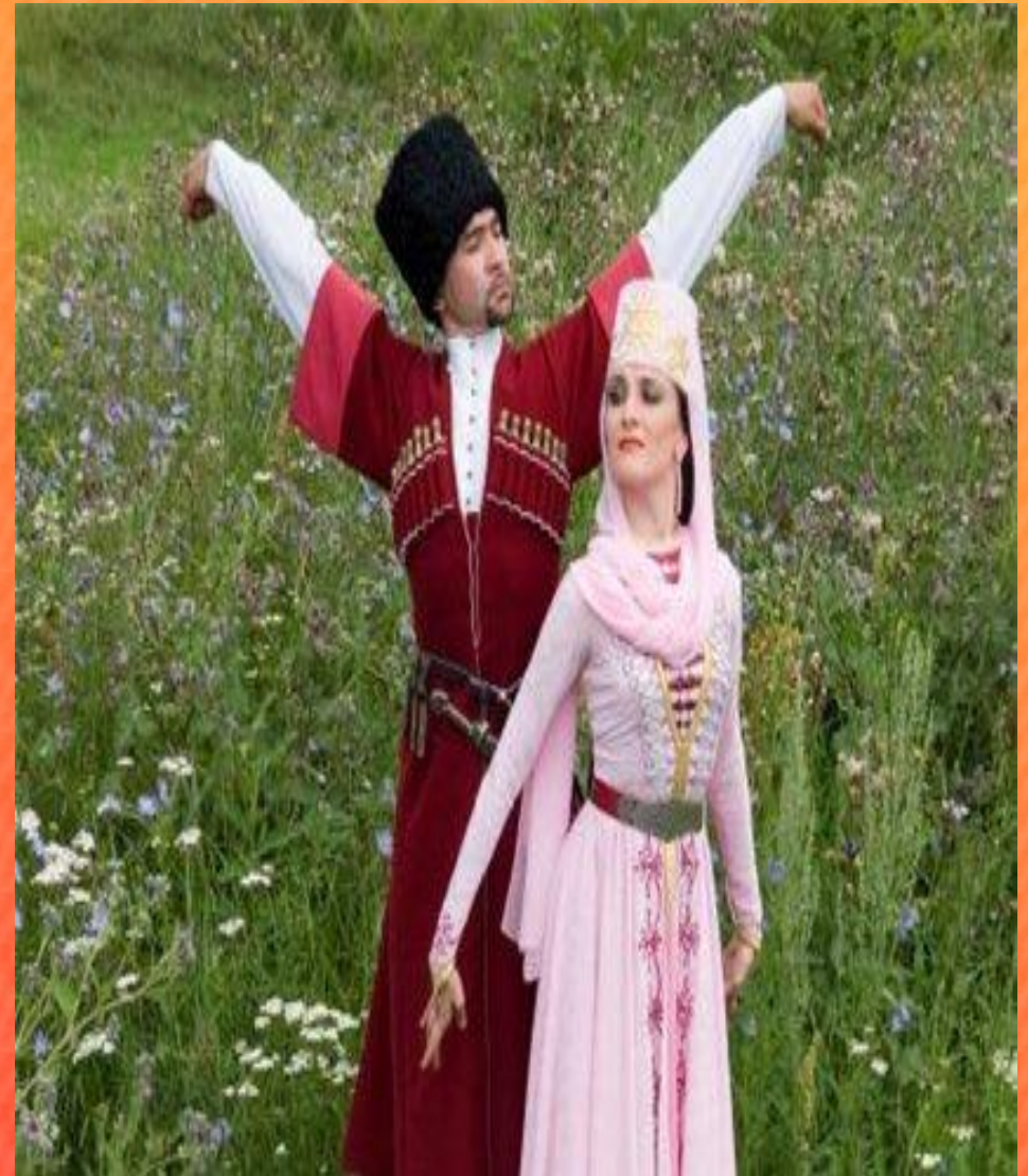
Народный костюм ингушей