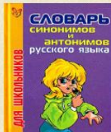
СИНОНИМОВ И АНТОНИМОВ