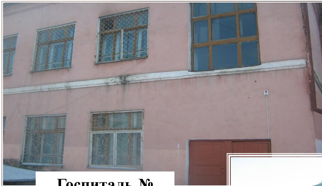
Госпиталь № 2508 07.41-01.43

Здание школы №2, Дома пионеров в настоящее время заброшено