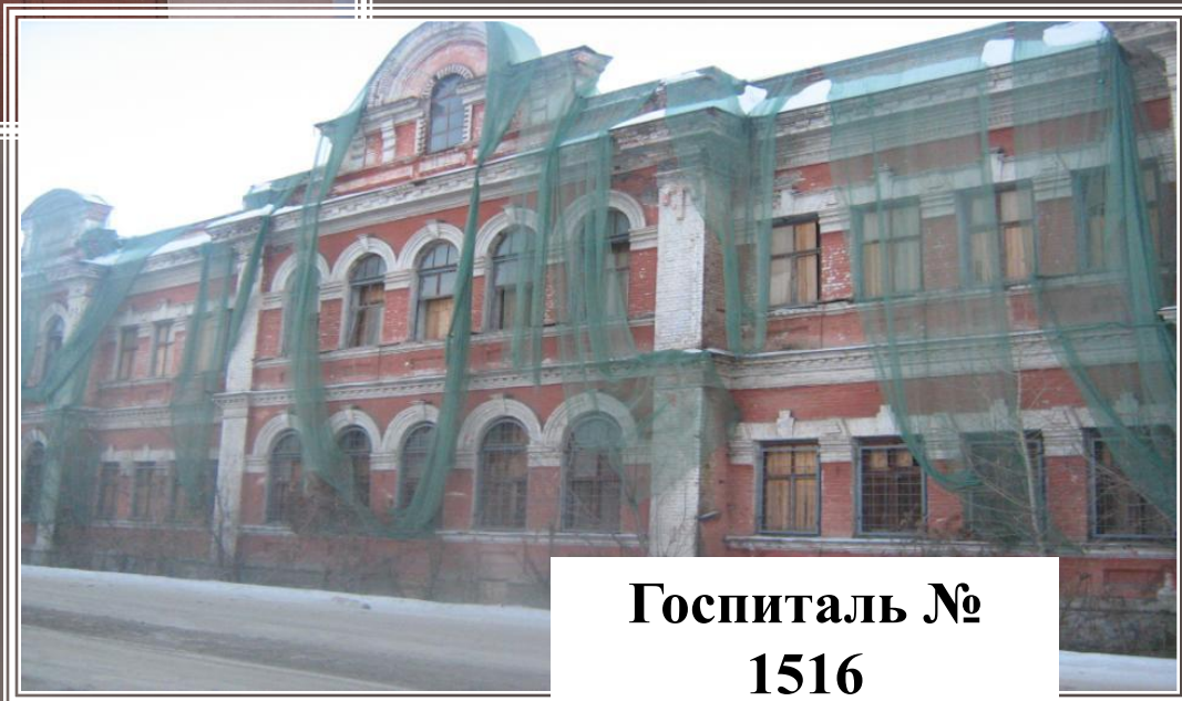
Госпиталь № 1516

Здание школы №2, Дома пионеров в настоящее время заброшено