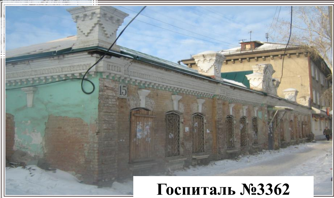
Госпиталь №3362 10.41-02.42