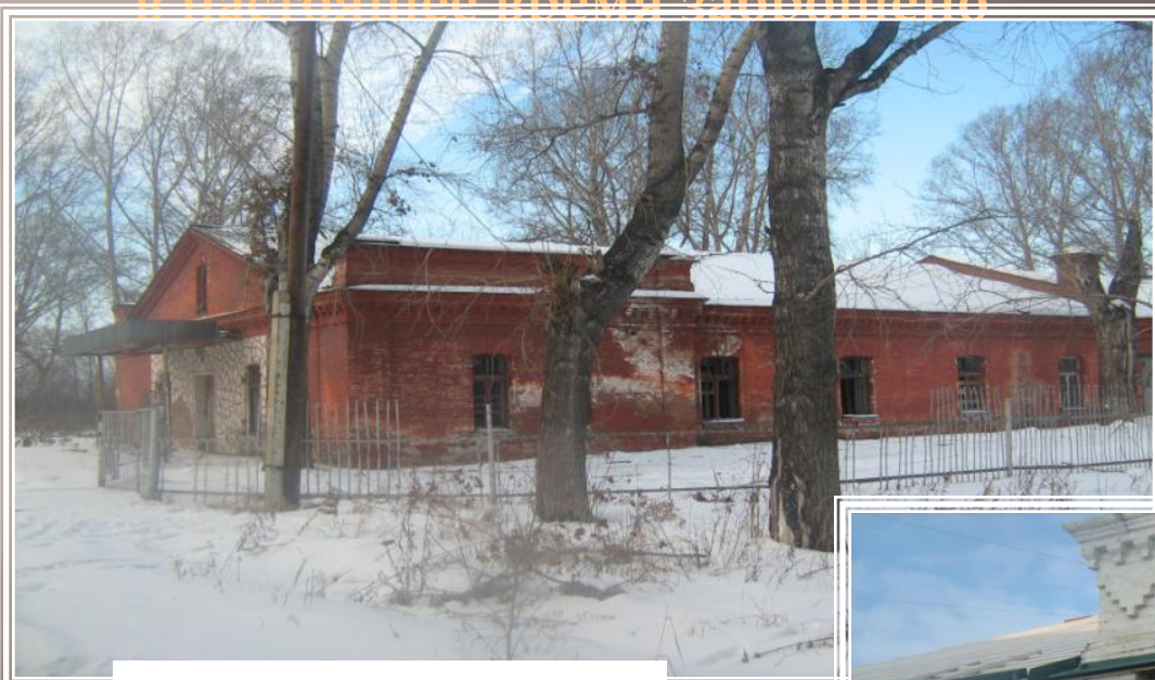
Госпиталь № 430