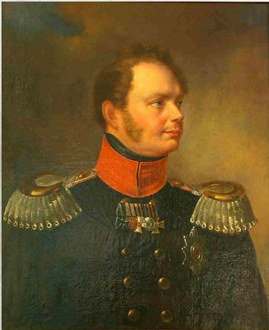
Король Пруссии Фридрих Вильгельм IV.