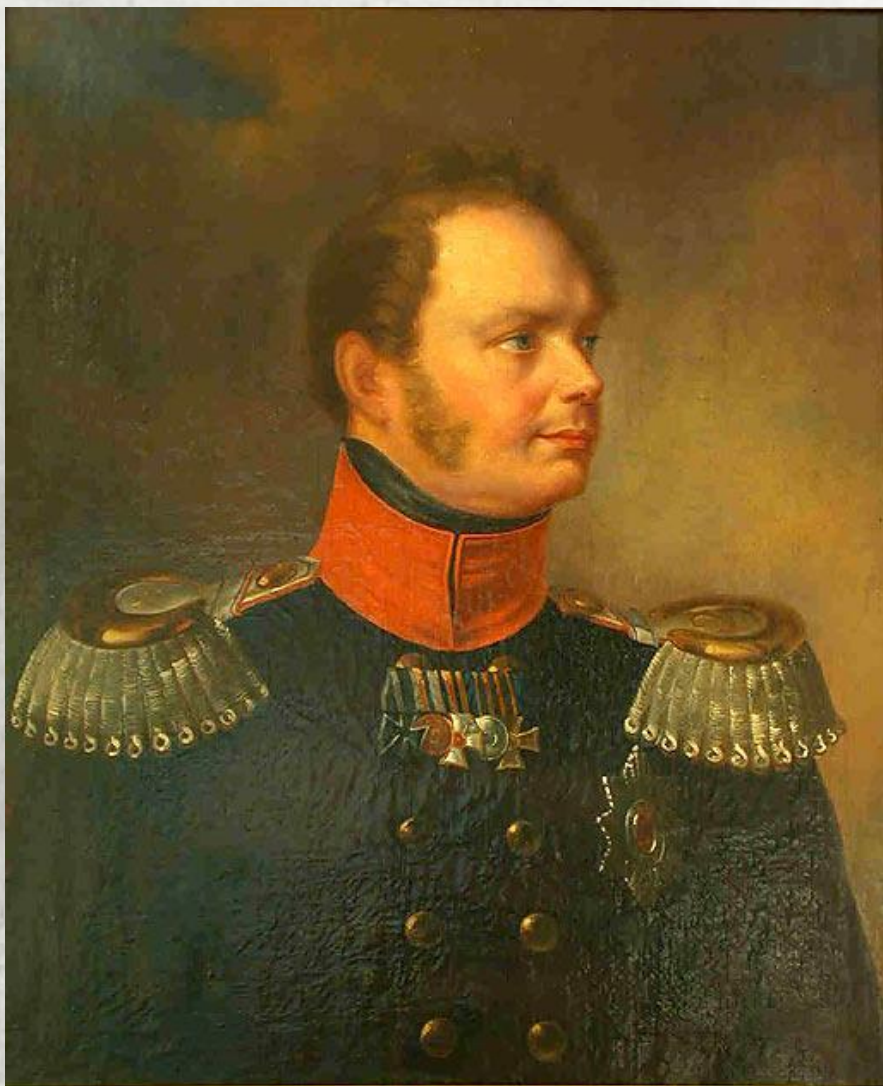
Король Пруссии Фридрих Вильгельм IV.