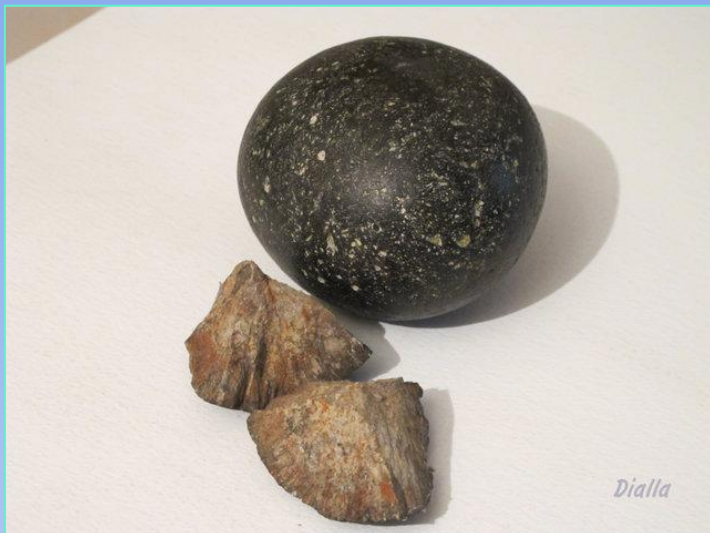
Мяч из камня