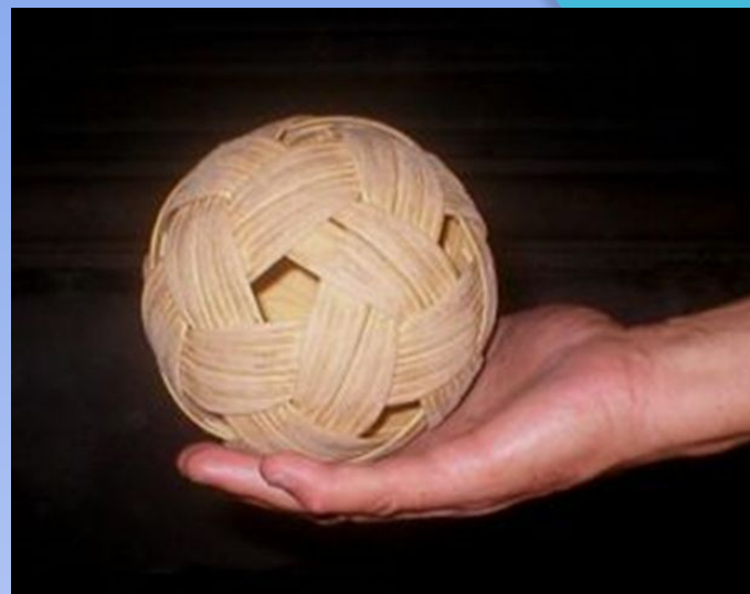
Мяч из тростника