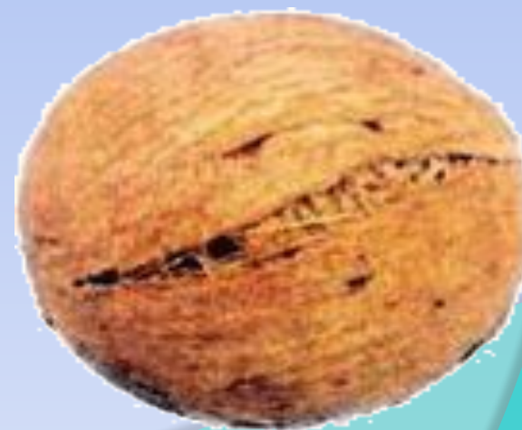
Мяч из травы