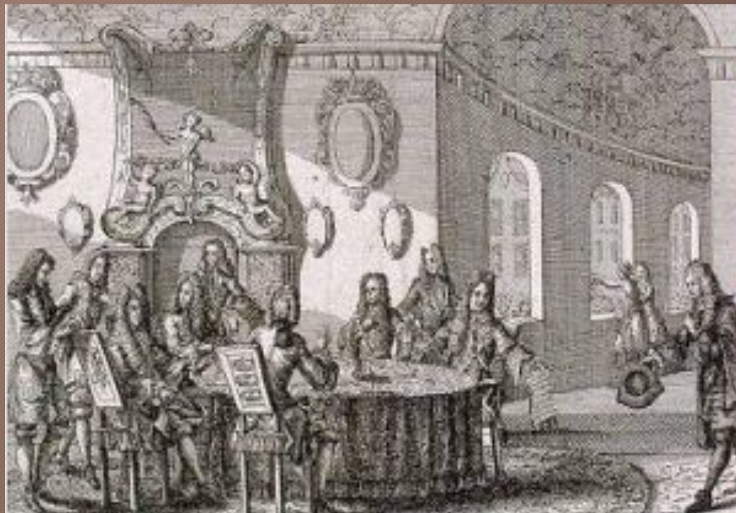
ПОДПИСАНИЕ НИШТАДТСКОГО МИРА