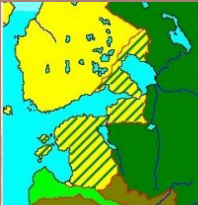
ИЗМЕНЕНИЕ ТЕРРИТОРИЙ ПОСЛЕ НИШТАДТСКОГО МИРА

- 22 октября 1721: Петр I на заседании сената принял титул императора Всея Руси.