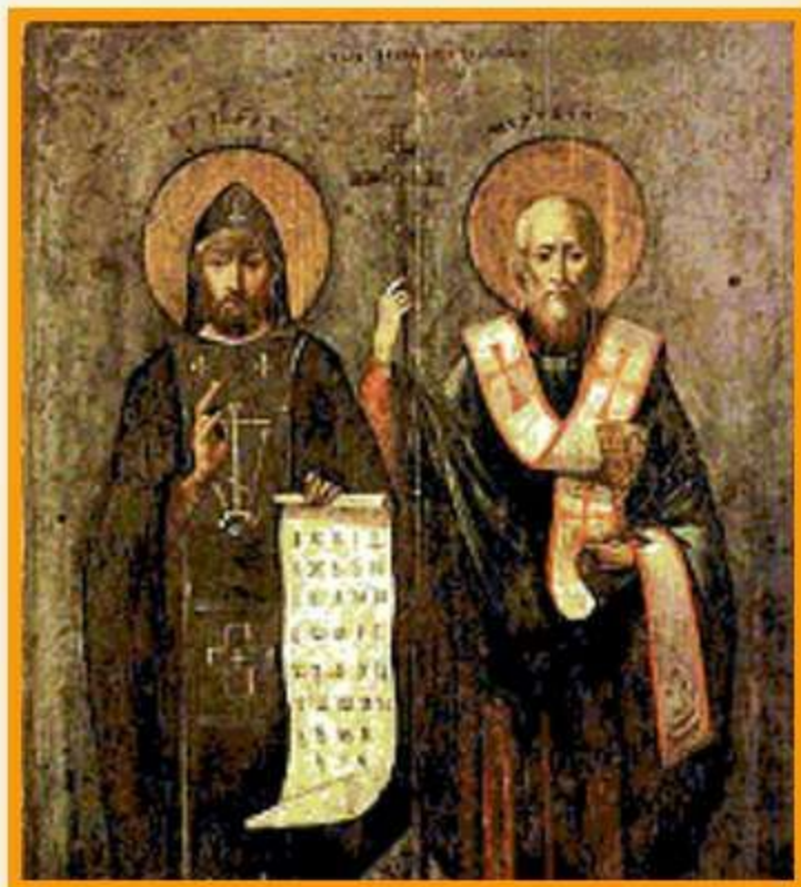
Византийские монахи Кирилл Философ и Мефодий – создатели славянской азбуки