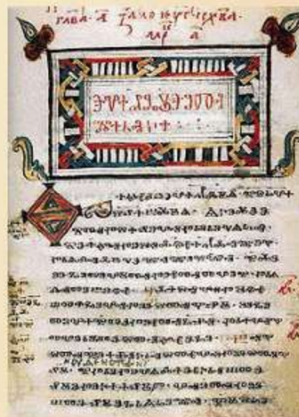
Глаголица — одна из первых славянских азбук для записи церковных текстов на славянском языке.