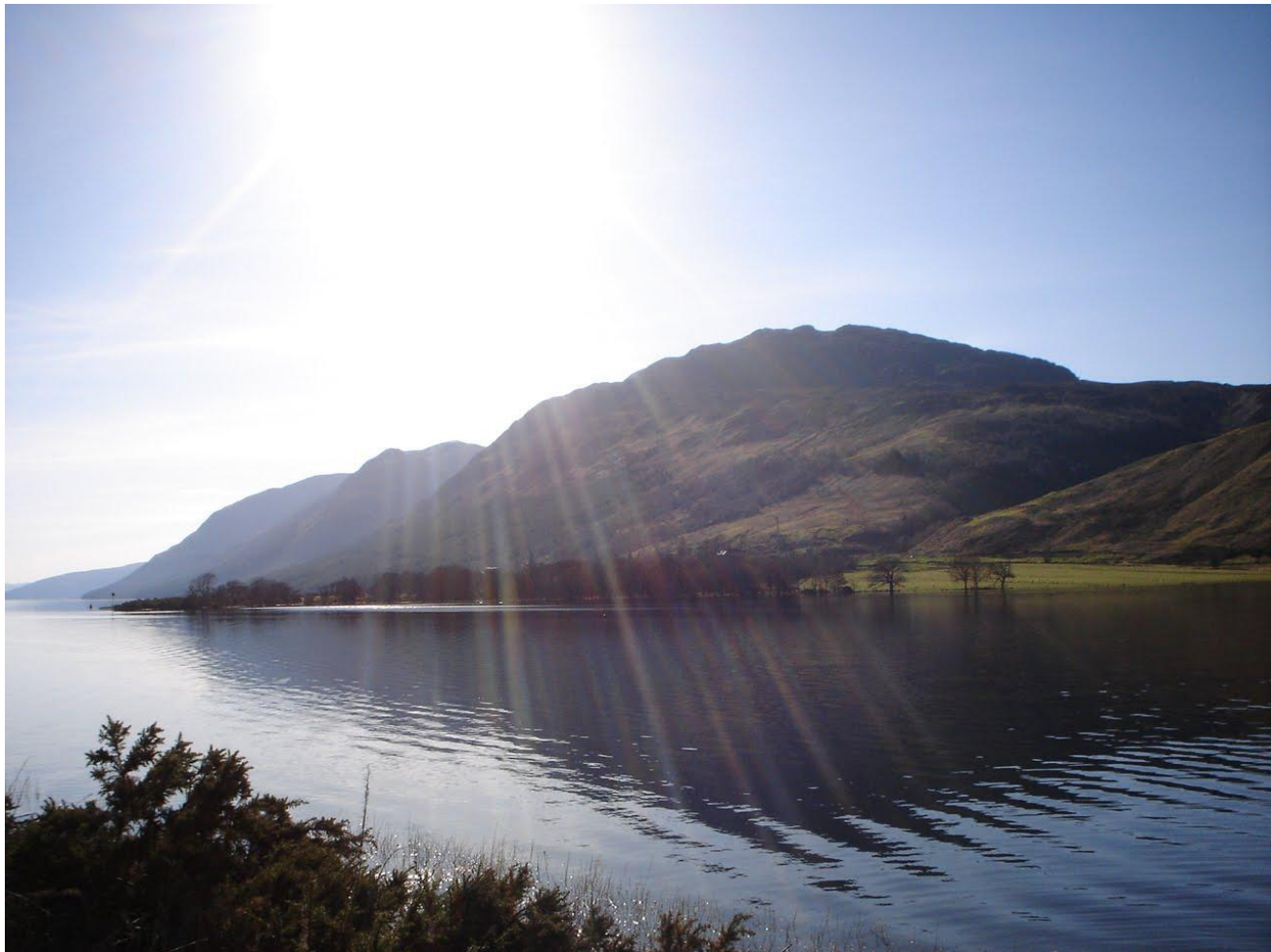
Loch Ness lake - озеро Лох-Несс