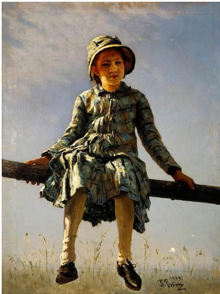
И. Репин «Стрекоза»