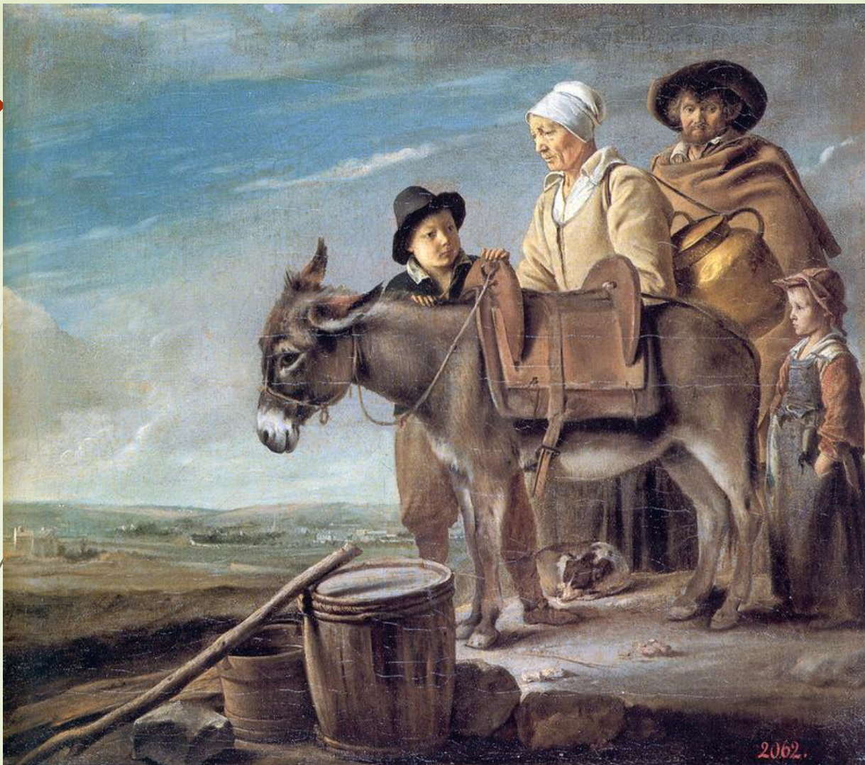
Луи Ленен. Семейство молочницы. 40е гг. XVII в