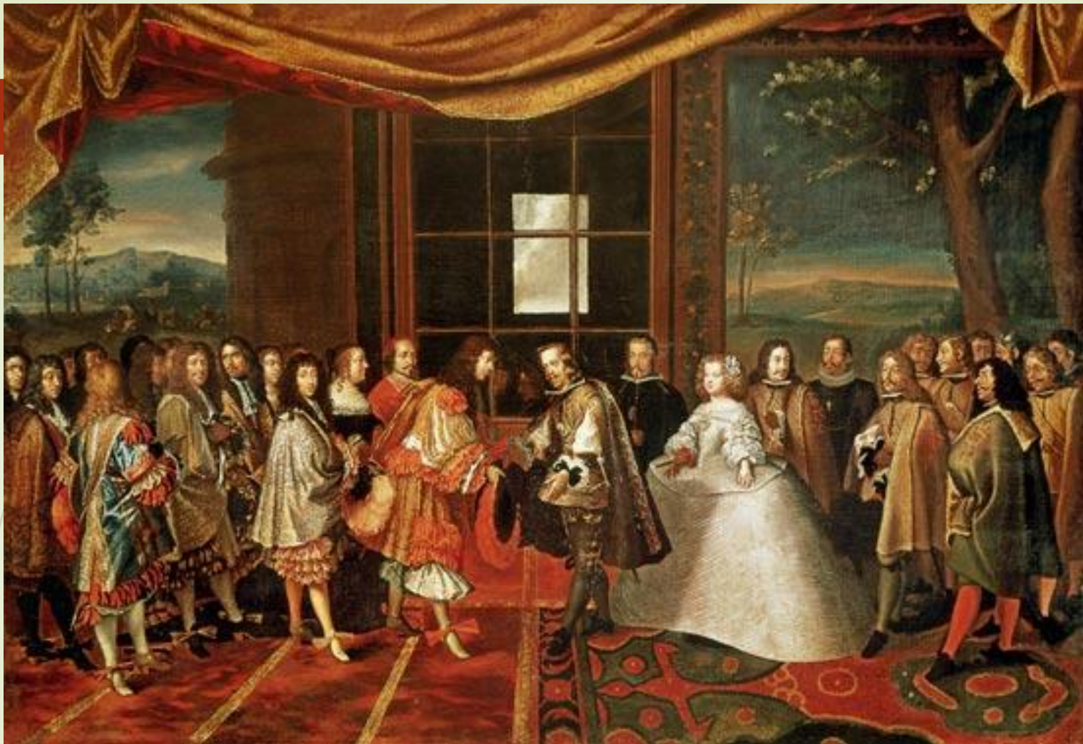
Встреча Людовика XIV с Филиппом IV.

Французские аристократы подражали своему правителю. Модная одежда называлась жюстокором (точно по телу).