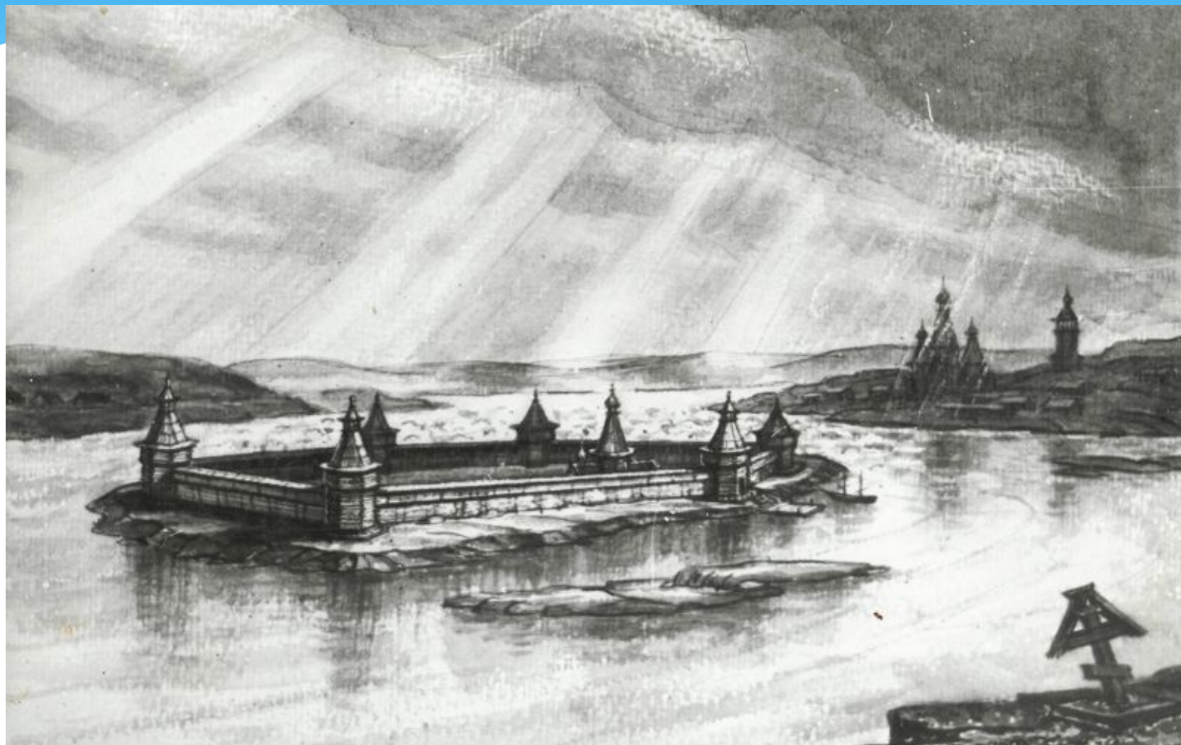
Рисунок реконструкции Кемской крепости. Автор заслуженный архитектор РСФСР Н.В. Куспак.