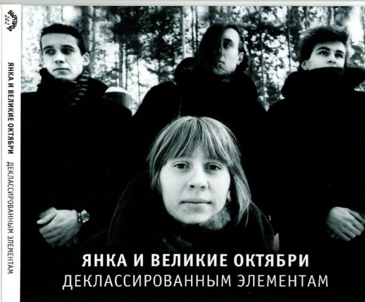
ЯНКА И ВЕЛИКИЕ ОКТЯБРИ • ДЕКЛАССИРОВАННЫМ ЭЛЕМЕНТАМ