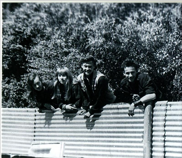
ЯНКА И ВЕЛИКИЕ ОКТЯБРИ • ДЕКЛАССИРОВАННЫМ ЭЛЕМЕНТАМ