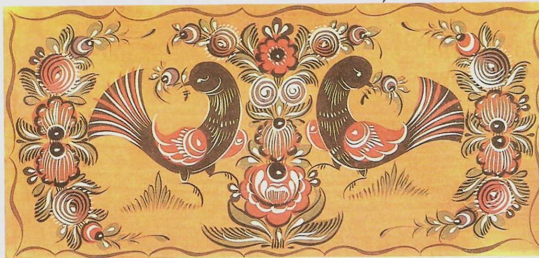
Декоративное панно «Птицы»

Городецкая роспись украшает детскую мебель, прялки, деревянную посуду, кухонные доски, сувениры.