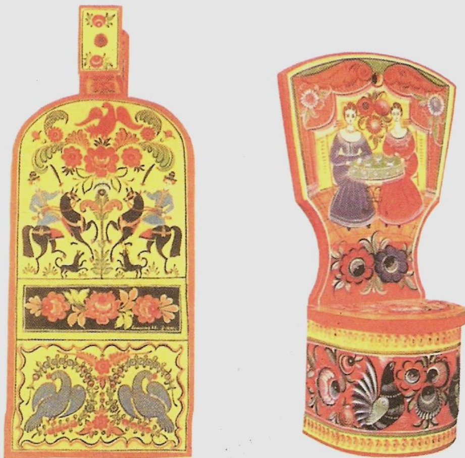
Изделия с городецкой росписью