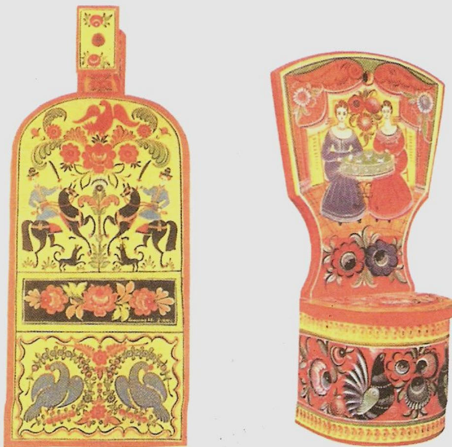
Изделия с городецкой росписью