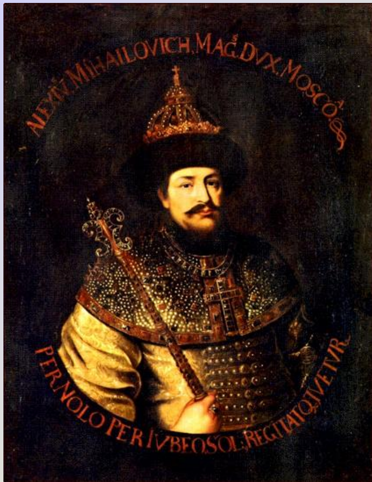
Алексей Михайлович (неиз . польск. худ.)

После первых побед и заключения Зборовского договора, казаки потерпели тяжелейшее поражение под м. Берестечком.