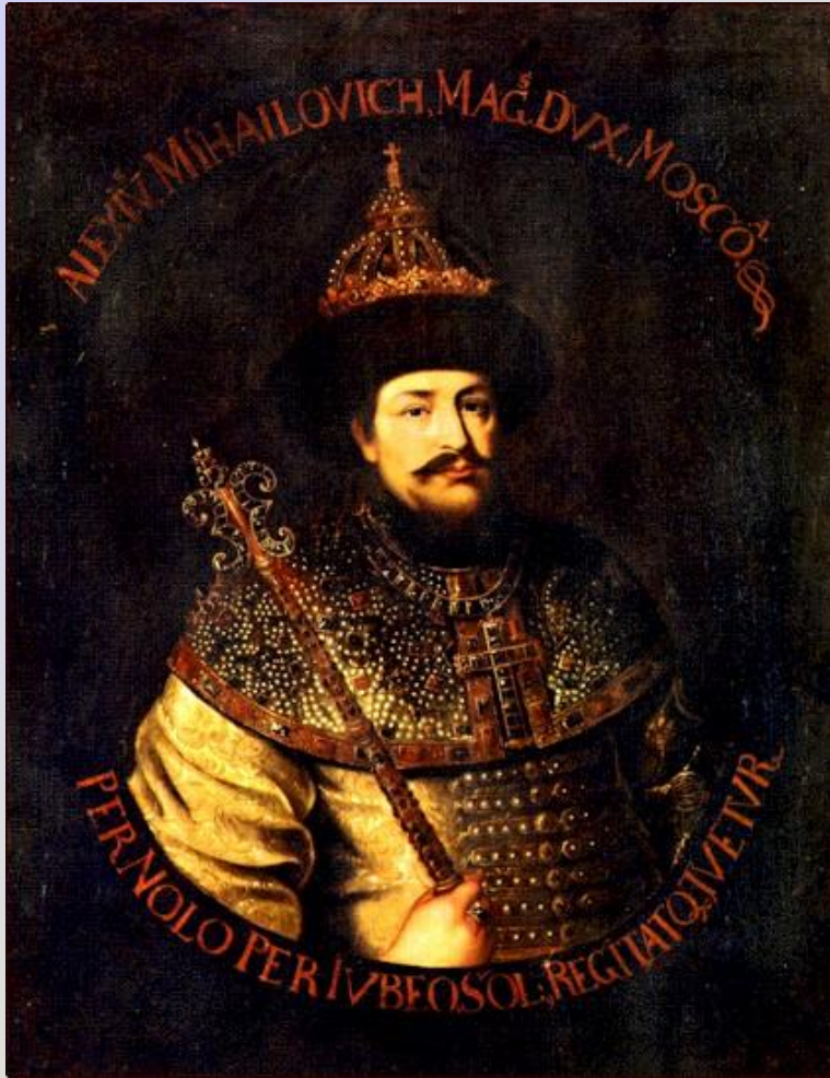
Алексей Михайлович (неиз . польск. худ.)

После первых побед и заключения Зборовского договора, казаки потерпели тяжелейшее поражение под м. Берестечком.