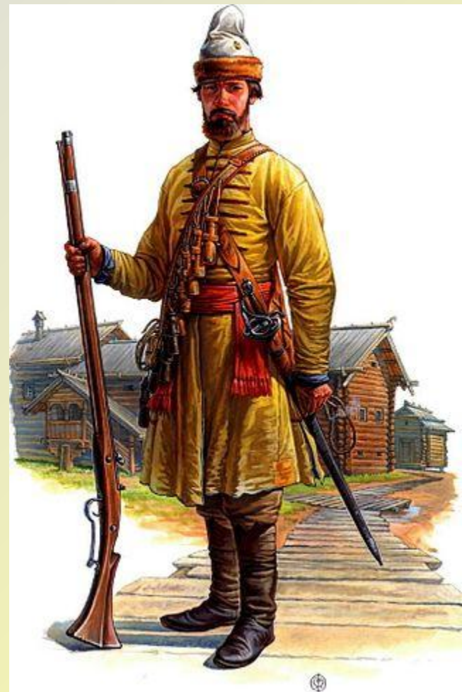
Русский солдат Первого выборного полка, 1660 г.