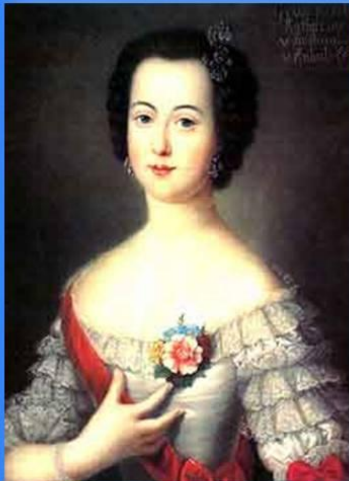
Великая княгиня Екатерина Алексеевна - будущая императрица Екатерина II

Когда в 14 лет Екатерина II переехала в Россию, здесь царствовала Елизавета Петровна. Острый и живой ум, красота немецкой принцессы обратили на себя внимание императрицы. Блистая при русском дворе красотой и умом, Екатерина весь свой досуг употребляла на самообразование. Она много читала. Едва ли в целой России была женщина образованнее нее. Русский язык Екатерина выучила так, что знала множество поговорок и писала на нем сочинения.