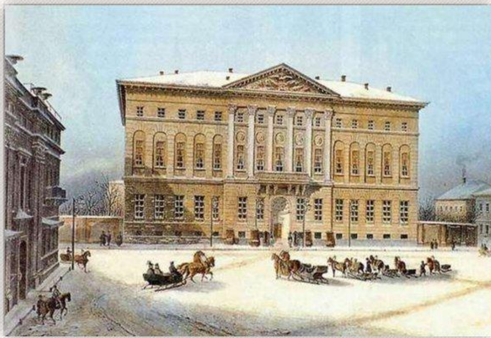
ДОМ ГЕНЕРАЛ-ГУБЕРНАТОРА МОСКВЫ