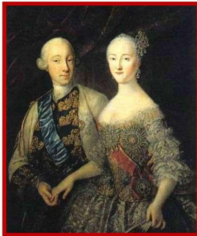
Петр Федорович, великий князь, Екатерина Алексеевна, великая княгиня.

Екатерина пришла к власти в ходе дворцового переворота, свергнувшего с престола её непопулярного мужа Петра III. Ее Правление длилось 34 года