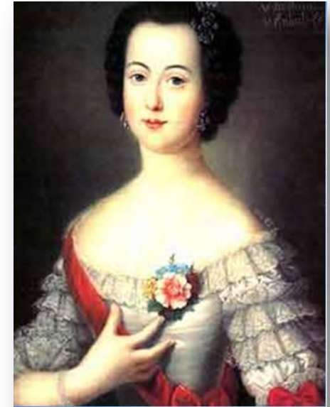
Великая княгиня Екатерина Алексеевна - будущая императрица Екатерина II

шестнадцатилетнем возрасте Екатерина была обвенчана с Петром Фёдоровичем, которому исполнилось 17 лет.