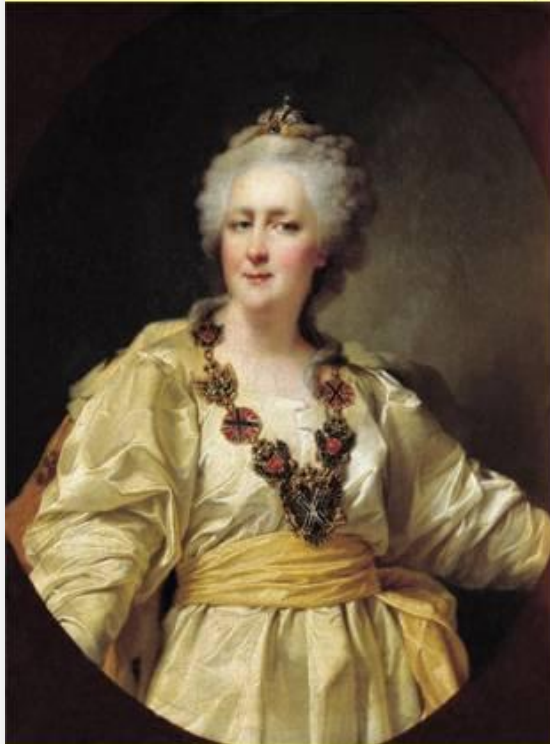
Екатерина II. Худ. Д.Г. Левицкий.

Реформы Екатерины II были направлены на создание в России правового государства, опирающегося на выборное сословное самоуправление, на постепенную передачу ряда функций государства обществу.