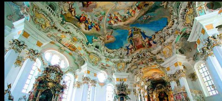
интерьер в стиле Рококо