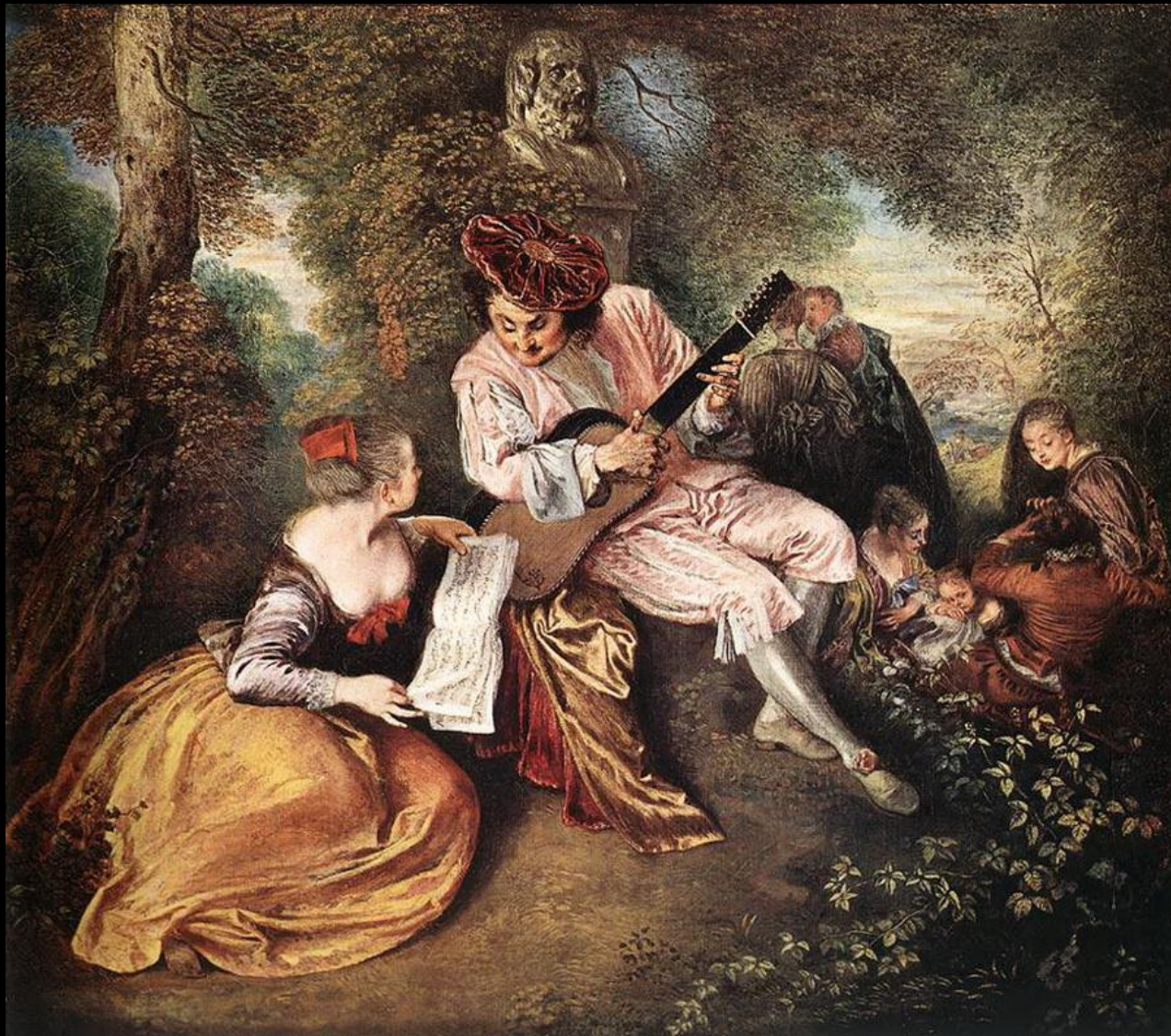
Антуан Ватто. «Песня о любви».