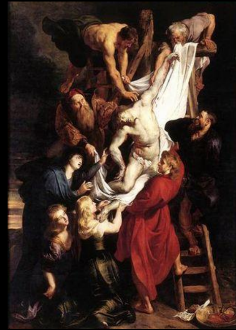
«Снятие с креста». Рубенс