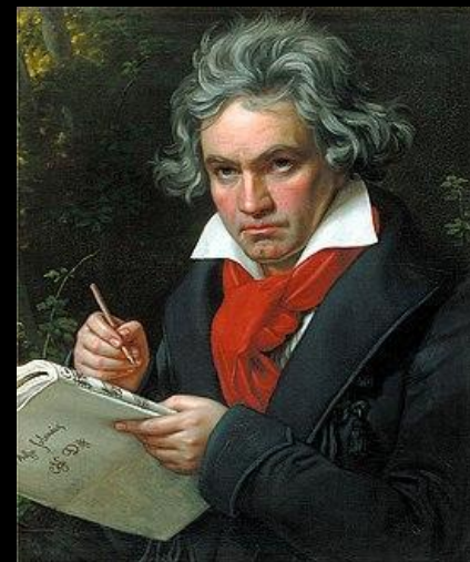
Л. Ван Бетховен