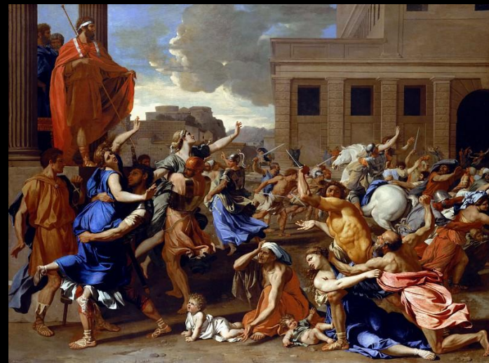
«Похищение сабинянок». Никола Пуссен