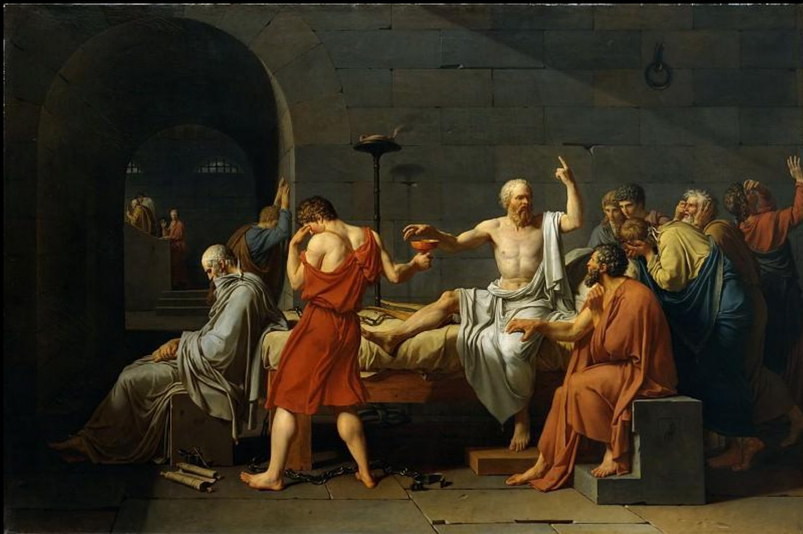
Жак Луи Давид. «Смерть Сократа».