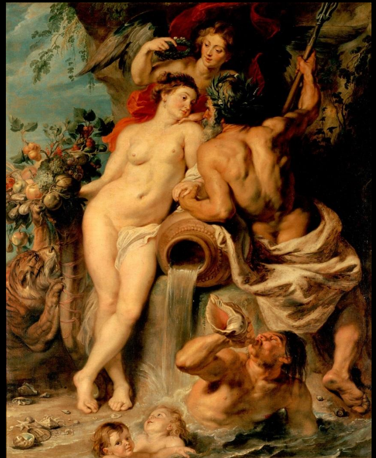
«Союз земли и воды». Рубенс