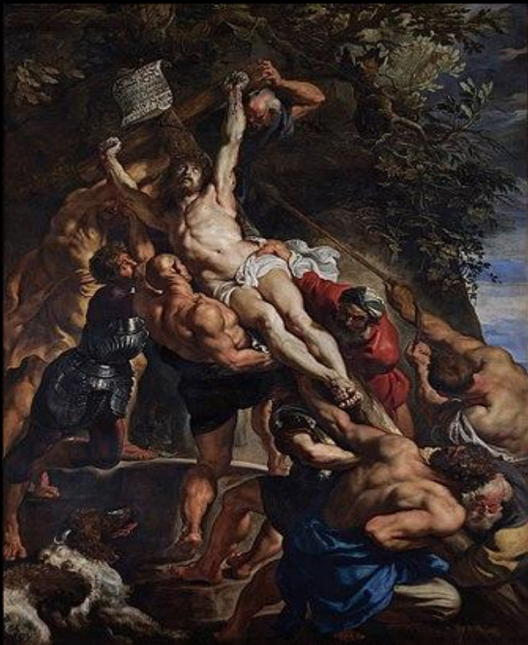
«Воздвижение креста». Рубенс