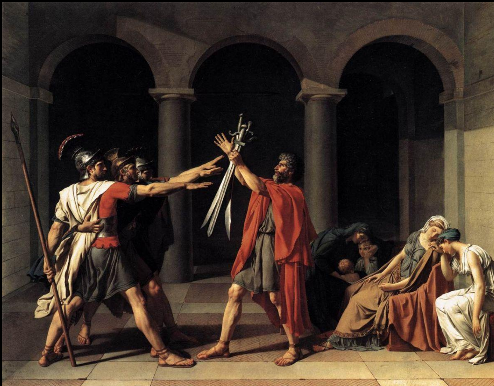
Жак Луи Давид. «Клятва горациев».