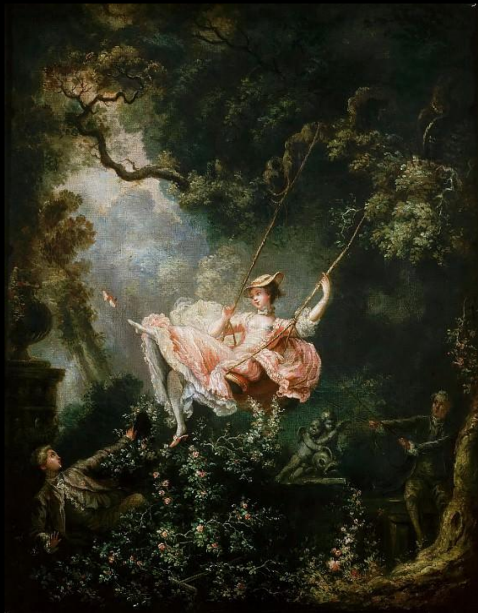
Жана Оноре Фрагонар. «Качели»