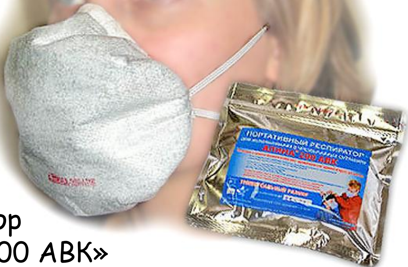
респиратор «Алина 200 АВК»