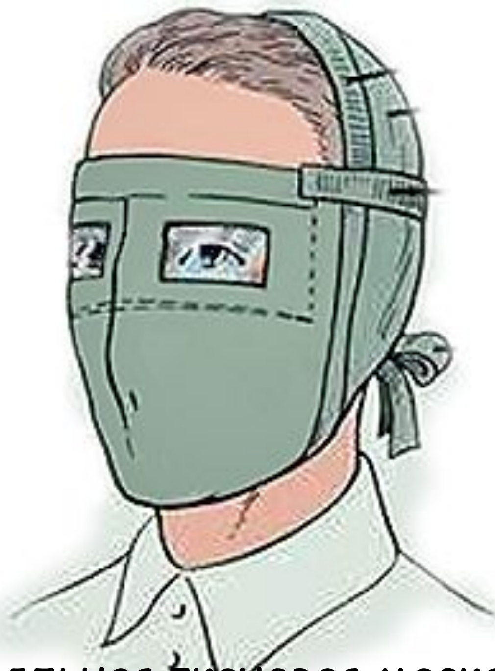
Противопыльная тканевая маска ПТМ