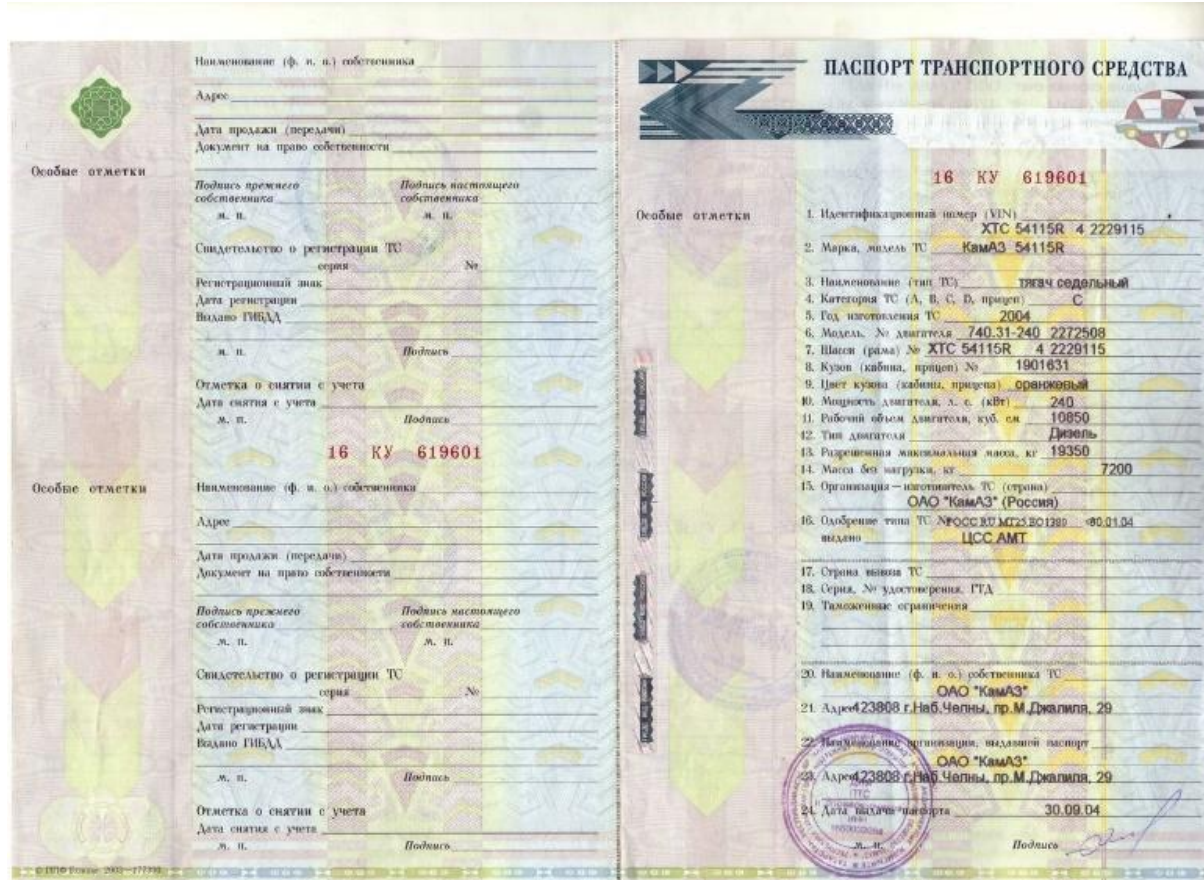
Паспорт транспортного средства (ПТС)