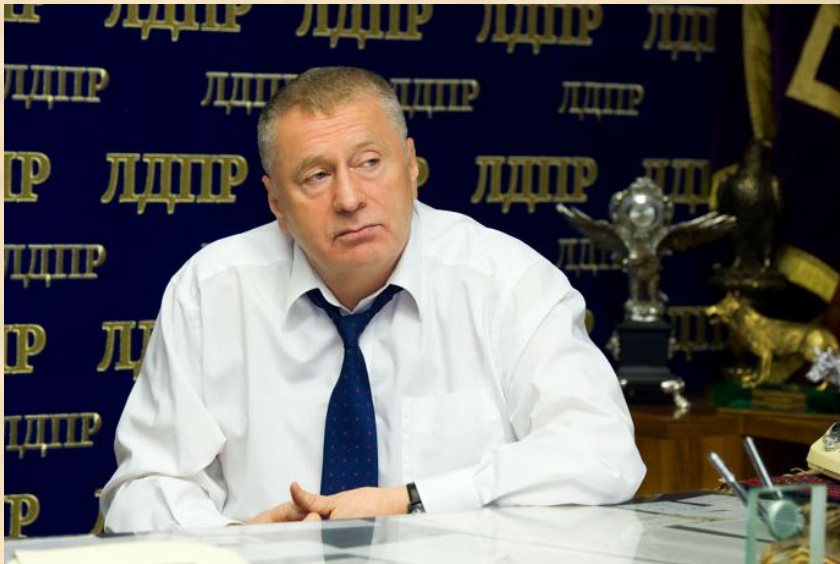
Председатель - ЖИРИНОВСКИЙ Владимир Вольфович.