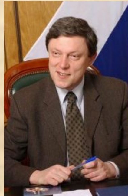
Явлинский Григорий Алексеевич (председатель до 2008)