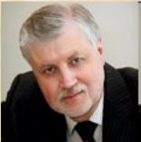
Миронов Сергей Михайлович