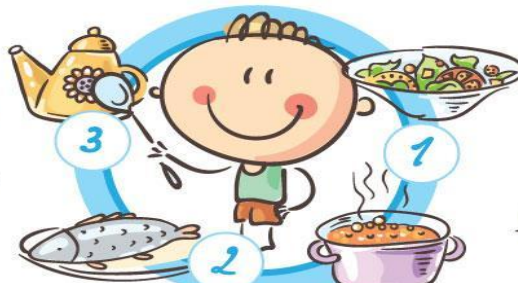
НЕ ПРОПУСКАЙТЕ ПРИЕМЫ ПИЩИ