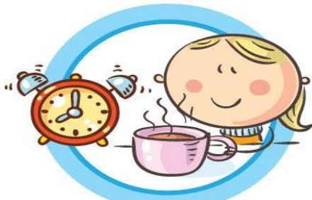
СОБЛЮДАЙТЕ ПРАВИЛЬНЫЙ РЕЖИМ ПИТАНИЯ