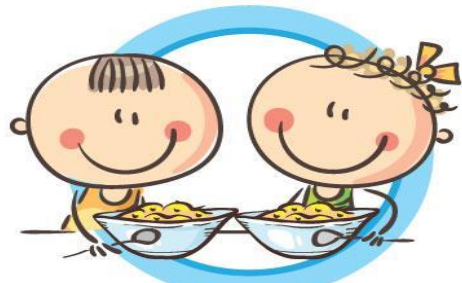
ПИТАЙТЕСЬ КАЖДЫЙ ДЕНЬ ВМЕСТЕ С ОДНОКЛАССНИКАМИ В ШКОЛЬНОЙ СТОЛОВОЙ