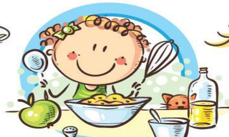
СЛЕДУЙТЕ ПРИНЦИПАМ ЗДОРОВОГО ПИТАНИЯ И ВОСПИТЫВАЙТЕ ПРАВИЛЬНЫЕ ПИЩЕВЫЕ ПРИВЫЧКИ