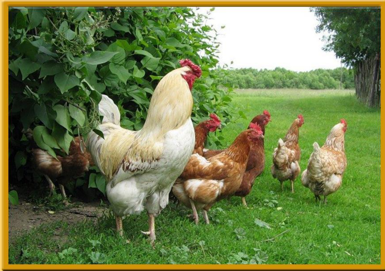
Петушок с семьей