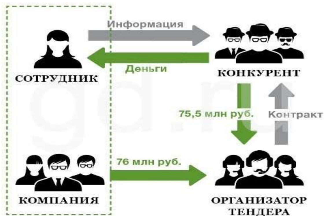
РИСУНОК 2 СХЕМА «БОЛТУН – НАХОДКА ДЛЯ КОНКУРЕНТА»