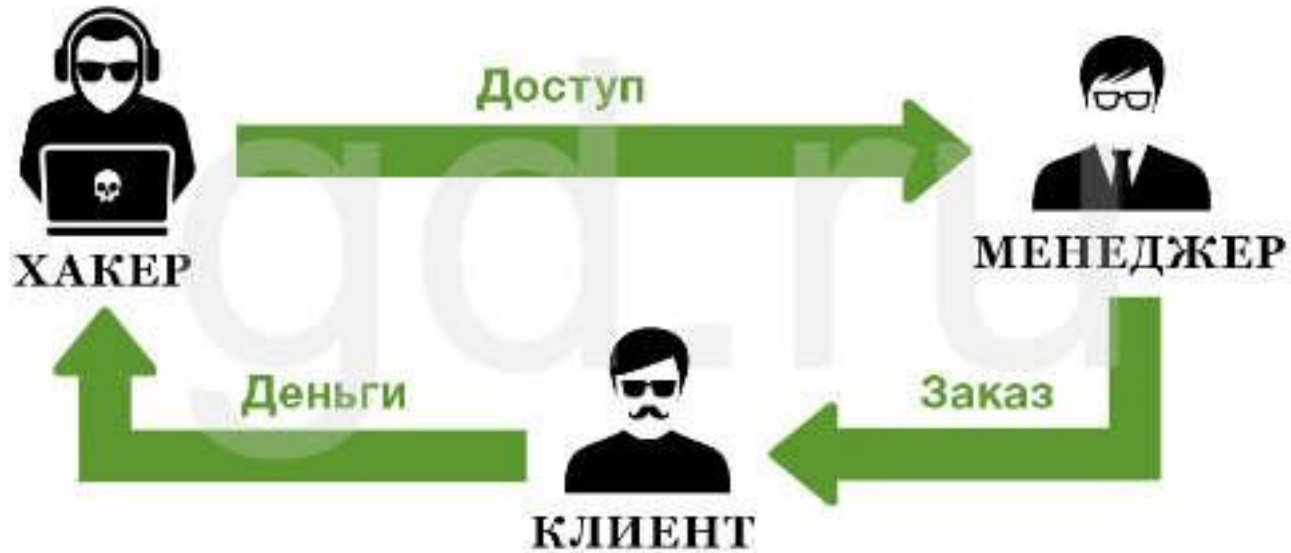
РИСУНОК 3 СХЕМА «КИБЕРПРОДАВЕЦ»