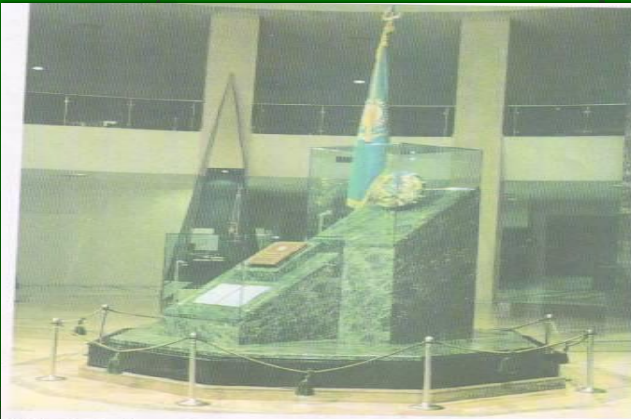
Еліміздің Туы, Елтаңбасы, Әнұраны, Конституциясы қойылған орын. ҚР Президенттік мәдениет орталығы.

1992 жылы 4-маусымда жаңа мемлекеттік рәміздер: Елтаңба, Ту, Әнұраны бекітілді.