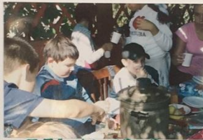
5.Б НА ПРИРОДЕ.