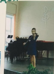
КАК УМЕЮТ ЭТИ РУКИ ЭТИ ЗВУКИ ИЗВЛЕКАТЬ?