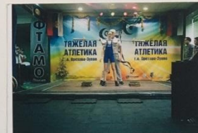
«МЫ ХОТИМ ВСЕМ РЕКОРДАМ НАШИ ЗВОНКЕ ДАТЬ ИМЕНА»