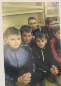
В ЗДОРОВОМ ТЕЛЕ - ЗДОРОВЫЙ ДУХ.