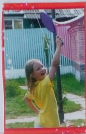
Играть в бадминтон