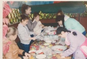
РАБОТА РАБОТОЙ, А ОБЕД ПО РАСПИСАНИЮ