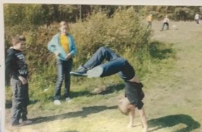
А ВАМ СЛАБО!?