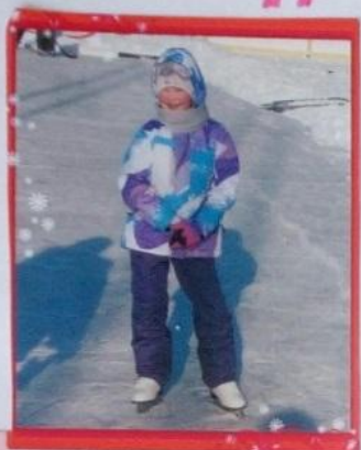
Кататься на коньках