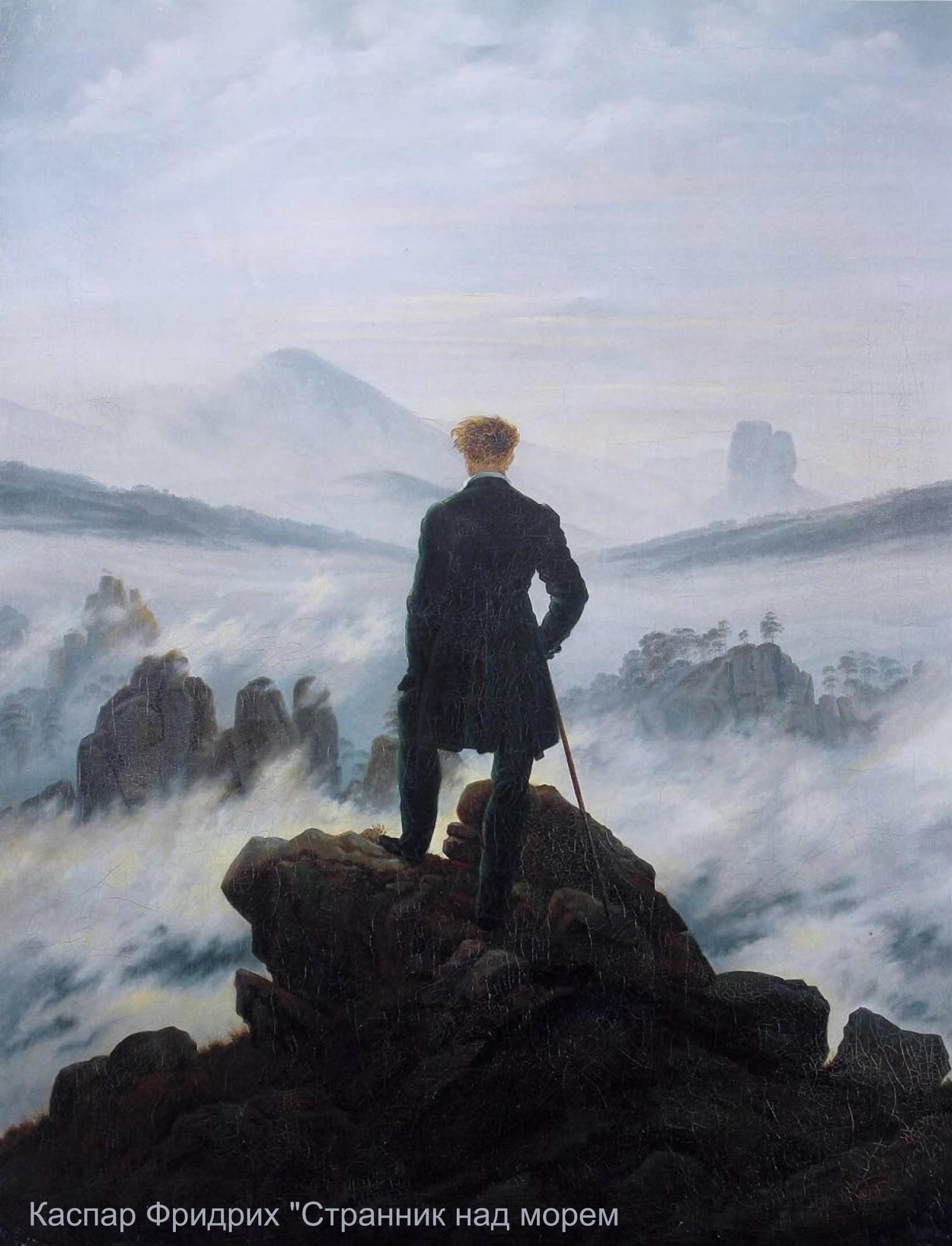
Каспар Фридрих "Странник над морем"