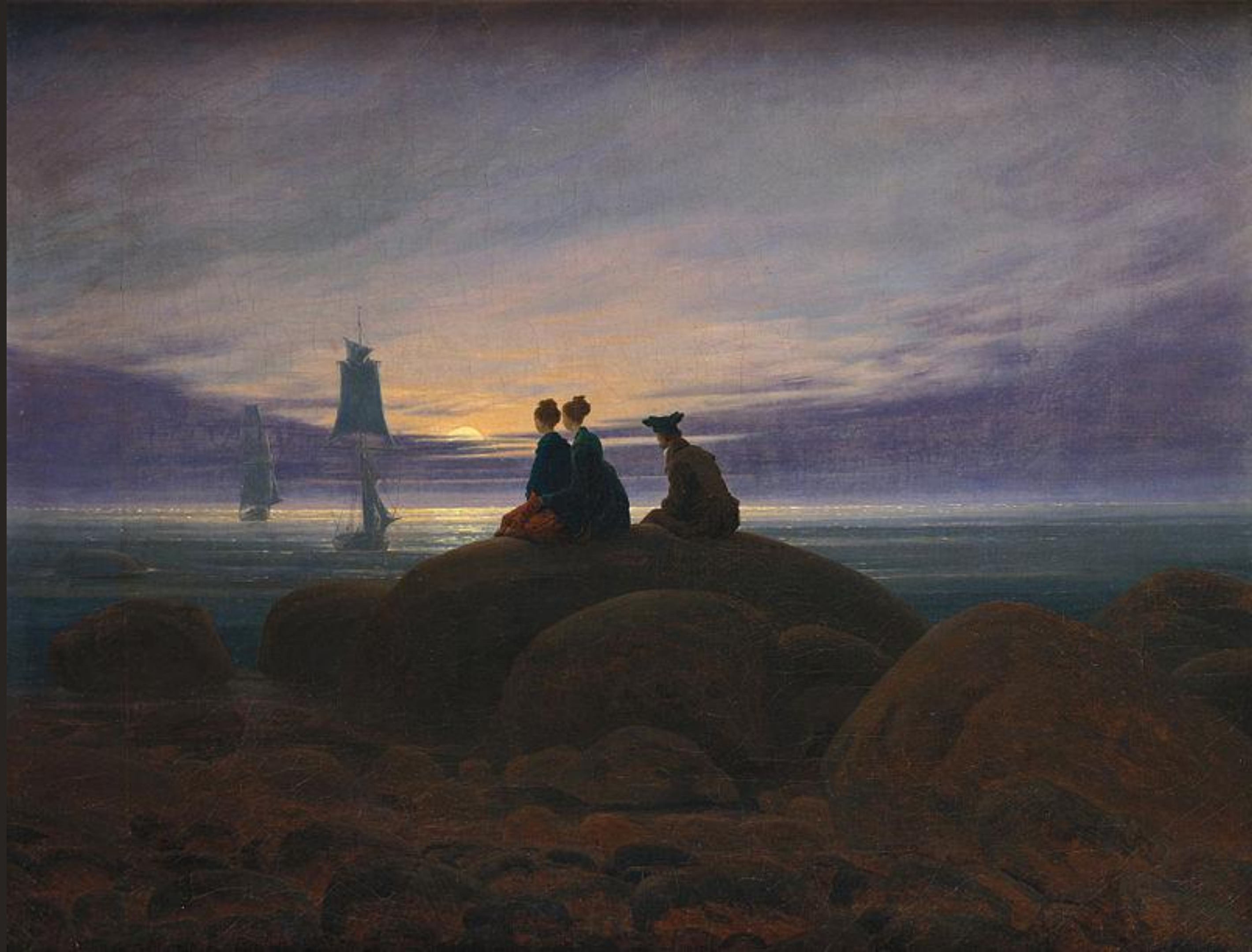
Каспар Давид Фридриха «Восход луны над морем»