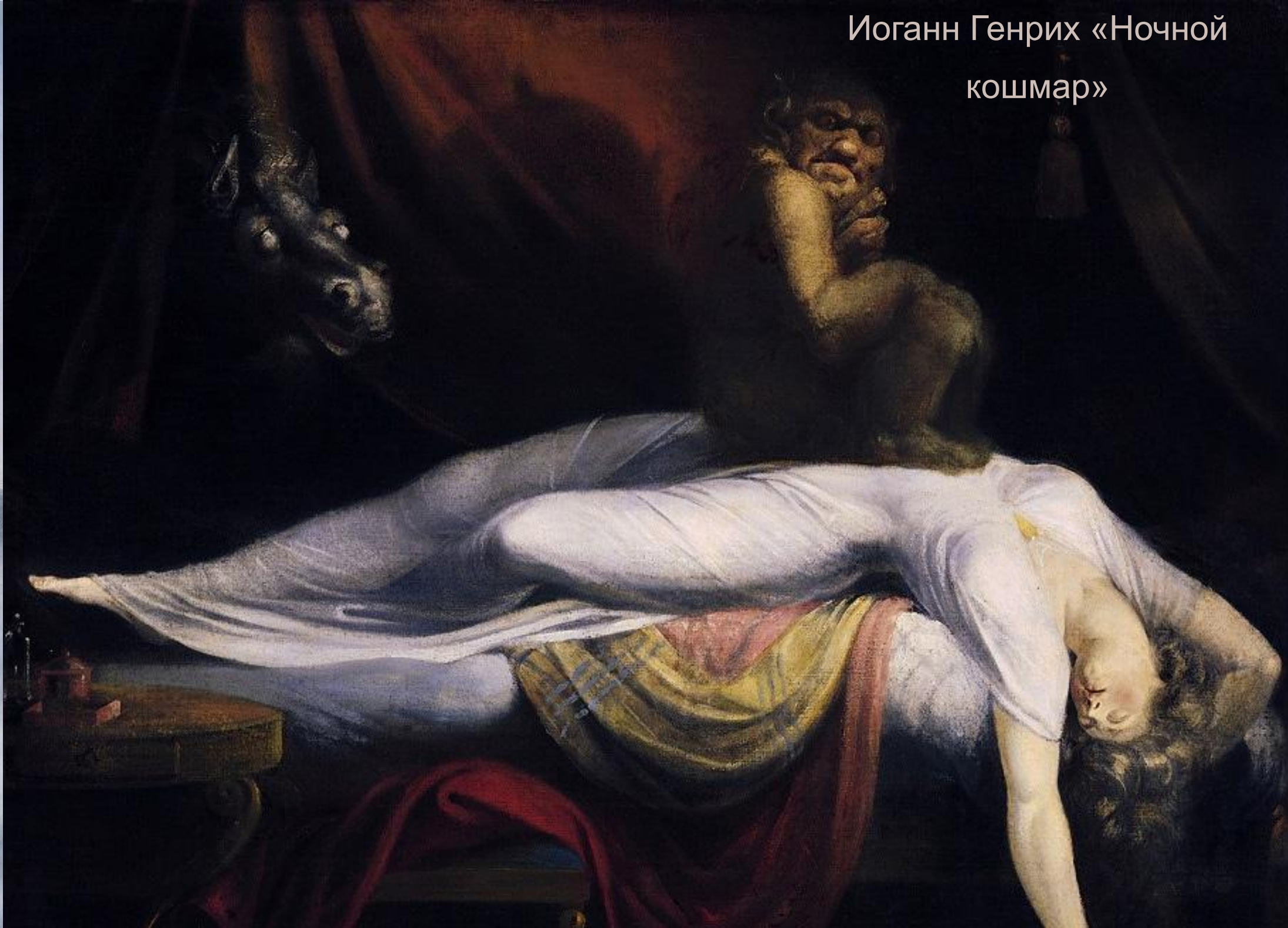
Иоганн Генрих «Ночной кошмар»

В картинах больше эффектов, призванных возбудить эмоции у зрител, вызвать чувство сопричастности к происходящему