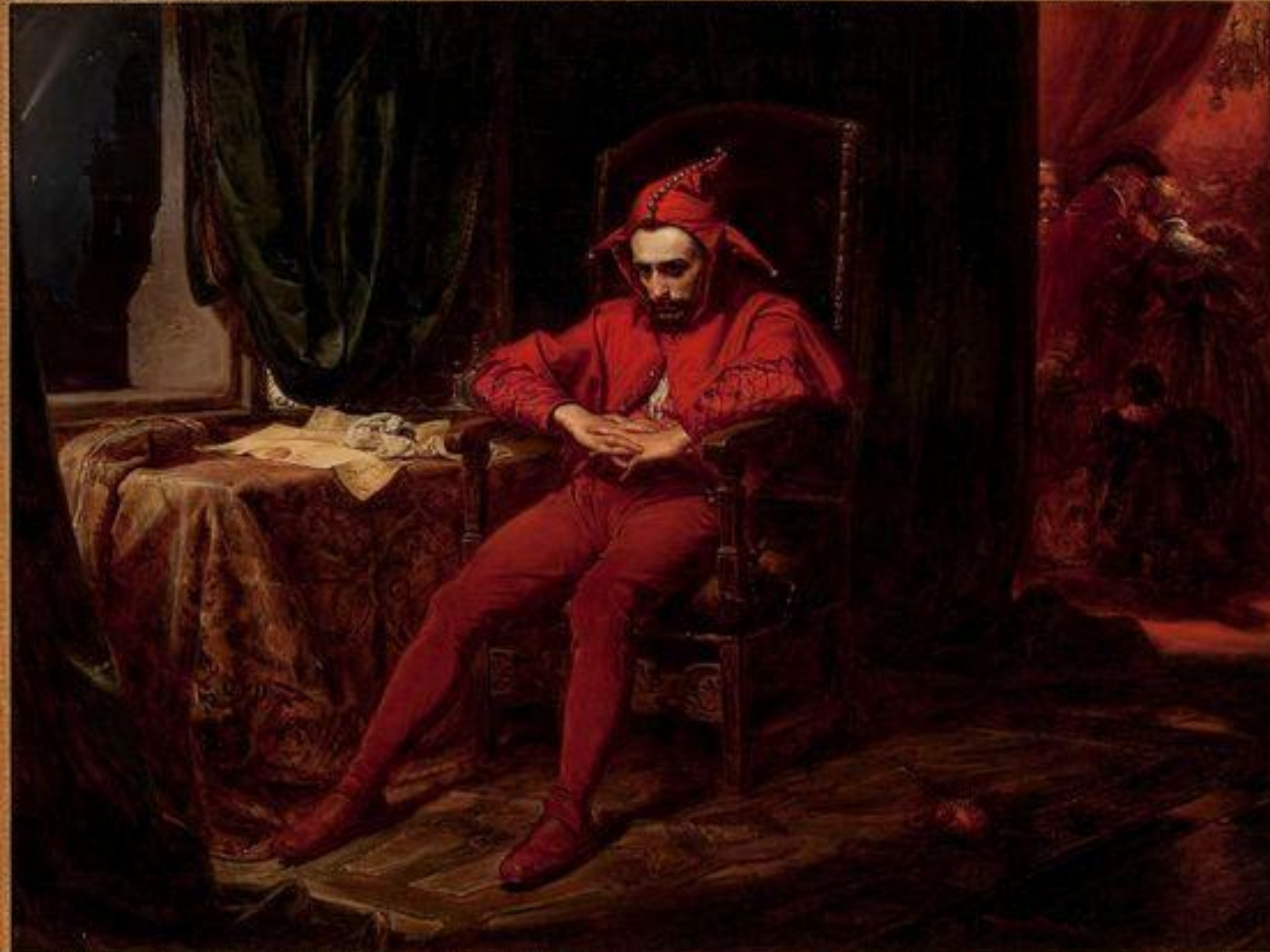
Ян Матейко «Станчик»