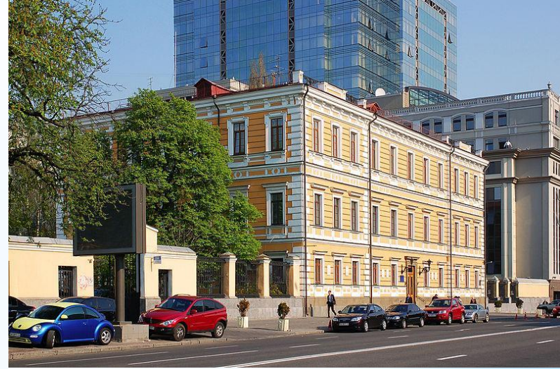
Приміщення НАН України по вулиці Володимирівській

* науково-виробничі, проектні установи і