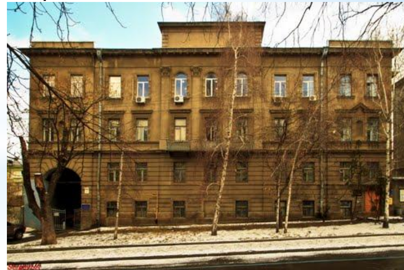
Інститут математики НАН України