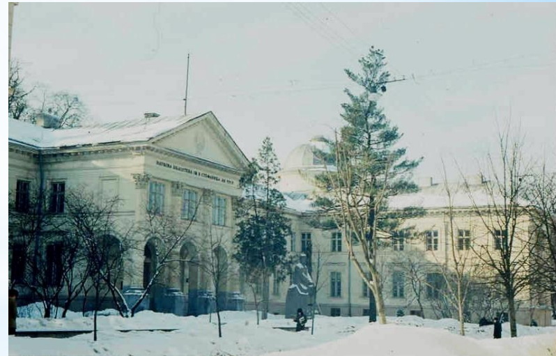
Львівська національна наукова бібліотека України імені Василя Стефаника