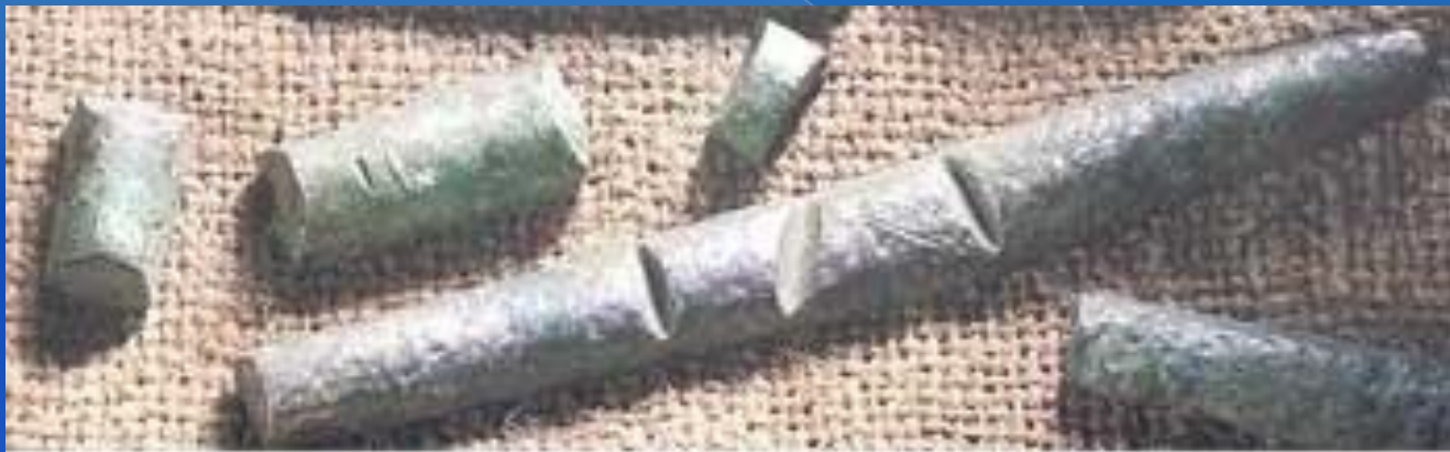
Серебряная гривна и ее части. XIV век.