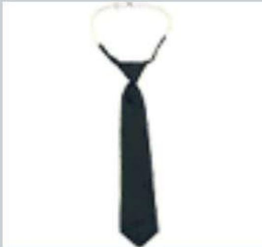
Галстук - регат