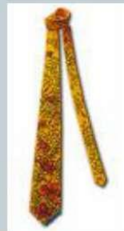
Галстук - самовяз