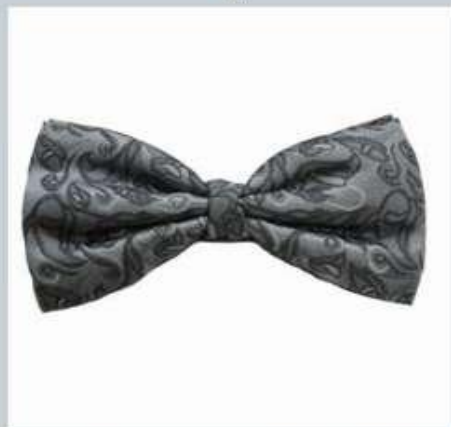
Галстук - бабочка