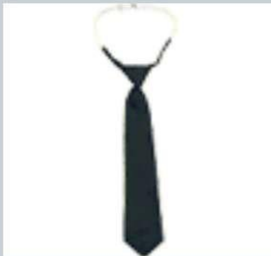
Галстук - регат