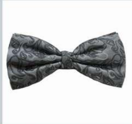
Галстук - бабочка