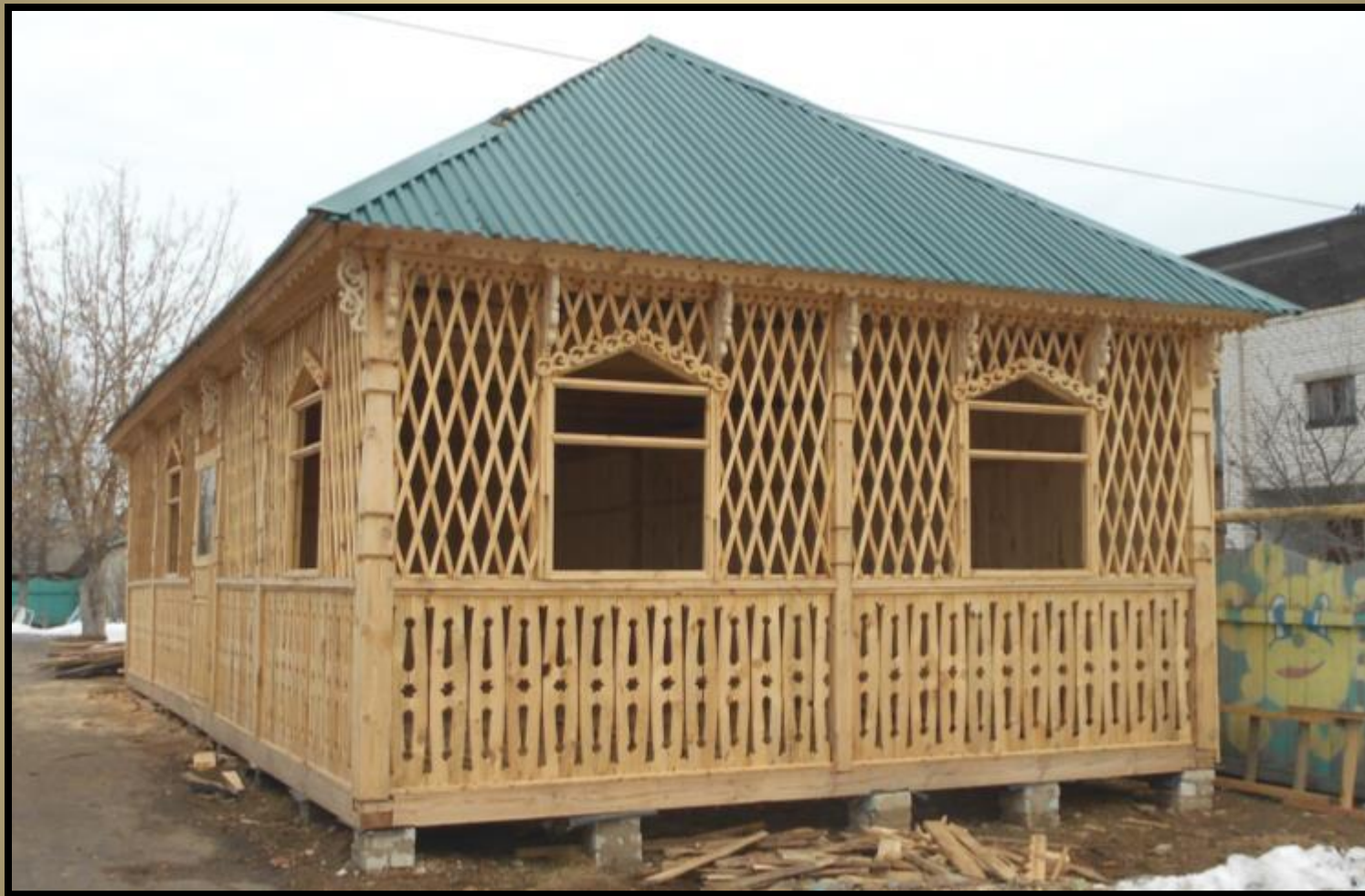
Внешний вид беседки