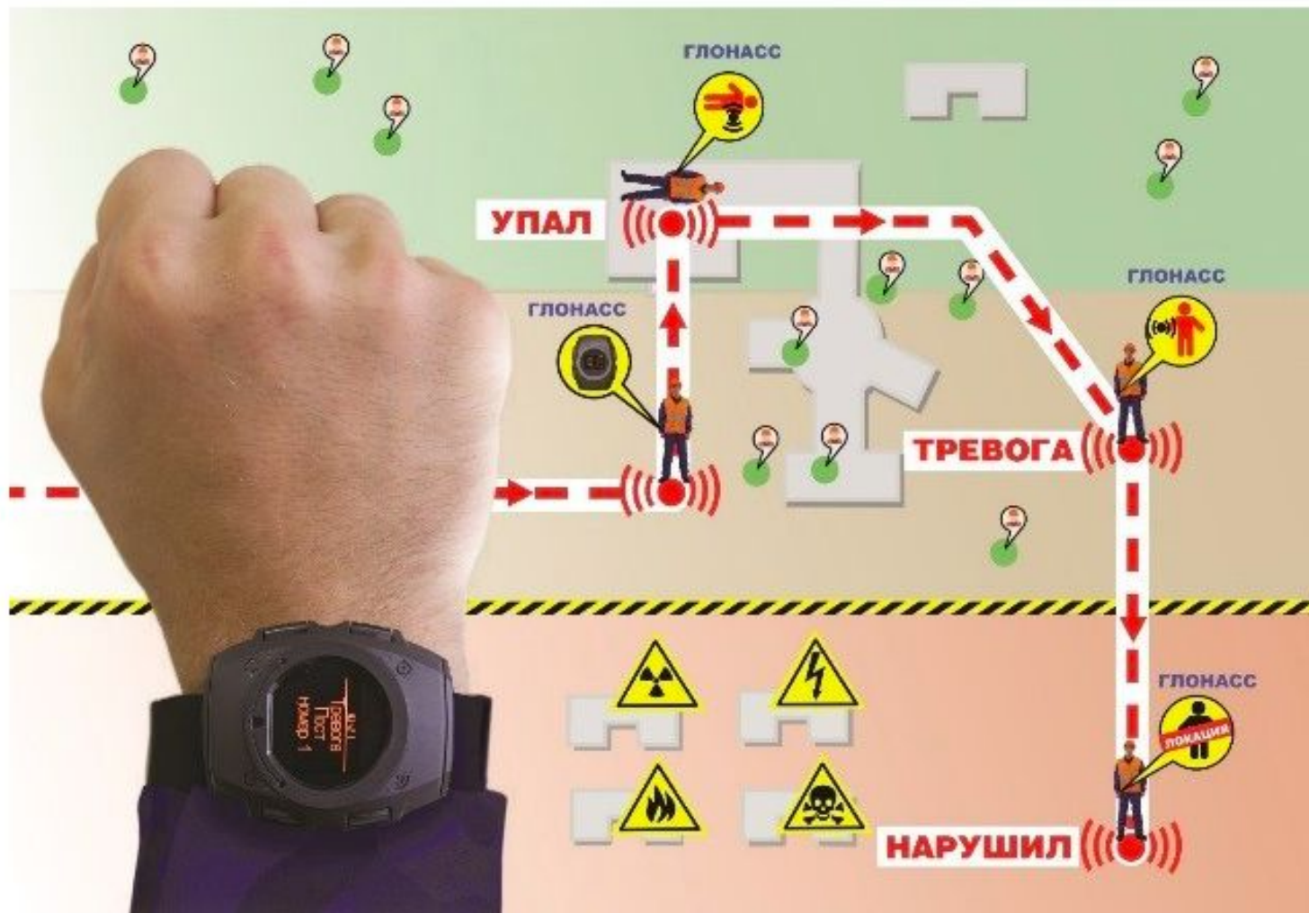
Контроль состояния и передвижения сотрудников