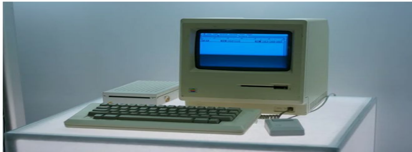
Компьютер Apple Macintosh

В 1981 году другая компания по созданию компьютеров IBM представила новую модель ПК – IBM 5150, также в этом году появился первый персональный компьютер в Советском Союзе – НЦ-8010. Но ни одна из этих моделей не включала в себя компьютерную мышь. Она появилась только в составе нового ПК, разработчиком которого выступила компания Apple в 1983 году – Apple Lisa.