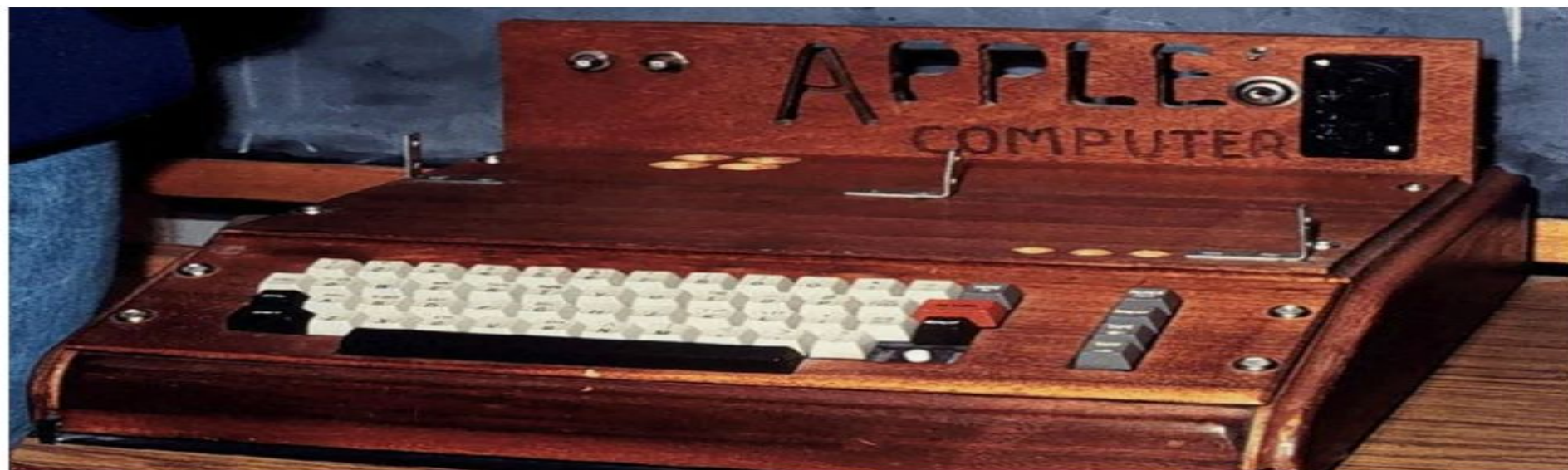
Компьютер Apple I

В 1976 году был выпущен ПК, направленный на массовую продажу и использование – Apple I. С новым персональным компьютером в комплекте не шел только монитор, в остальном все составляющие современной модели уже присутствовали в компьютере от Apple. Уже в 1977 году этот недостаток был устранен, и компания стала выпускать модели с собственными мониторами.