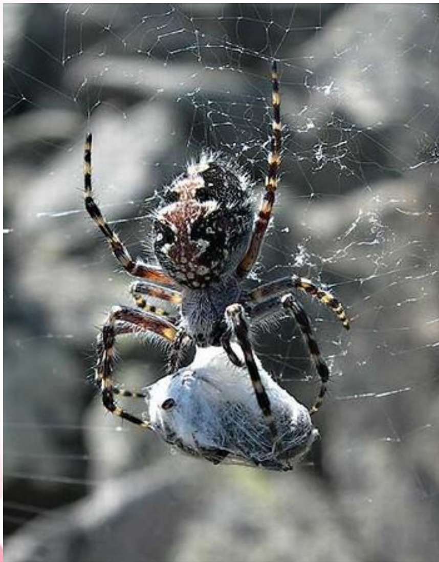
Паук - крестовик