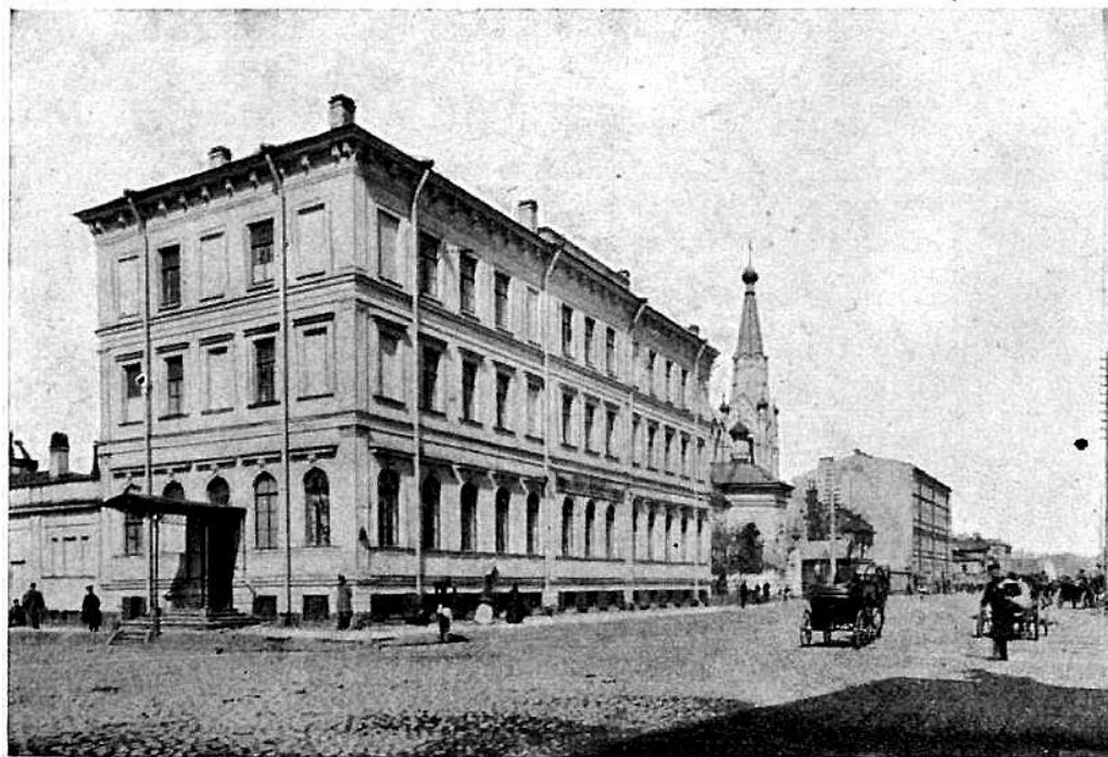
Видъ приюта Великой Княгини Александры Николаевны въ Измайловскомъ полку 12 рота № 27. (См. стр. 17).