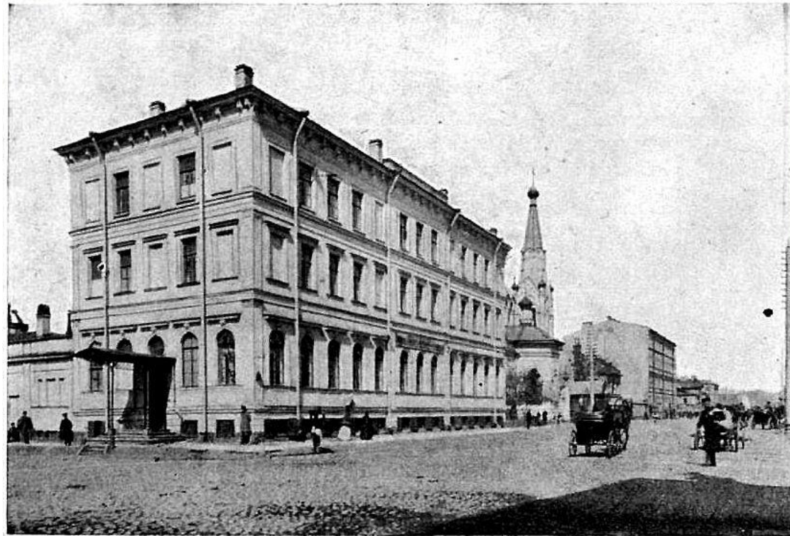
Видъ приюта Великой Княгини Александры Николаевны въ Измайловскомъ полку 12 рота № 27. (См. стр. 17).