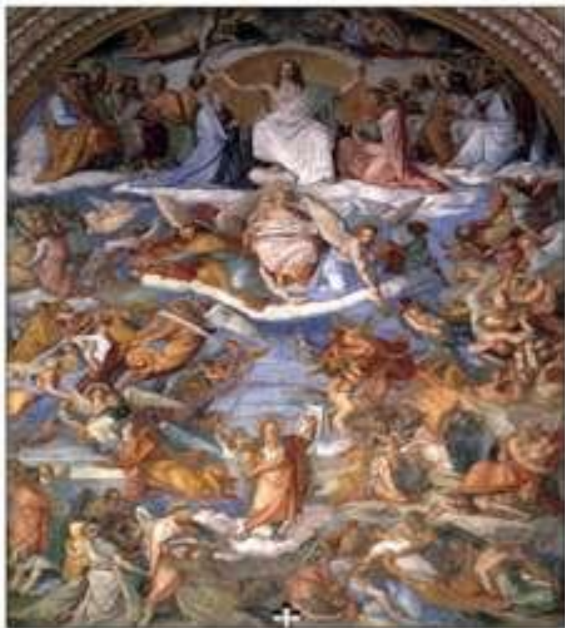
Питер фон Корнелиус (к «Божеств. комедии» Данте)