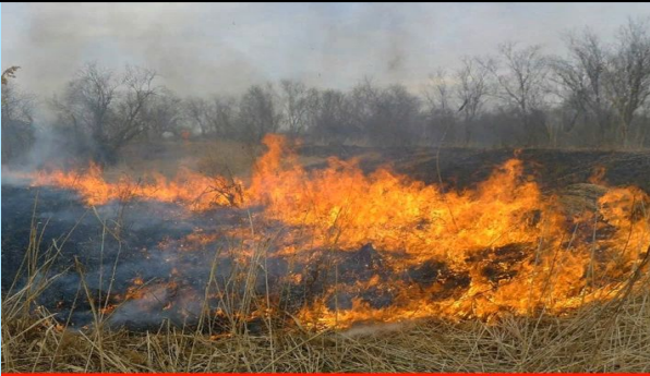
ВОЗГОРАНИЕ СУХОЙ РАСТИТЕЛЬНОСТИ

Прогнозируемые риски. Чрезвычайная пожароопасность (5 класс)