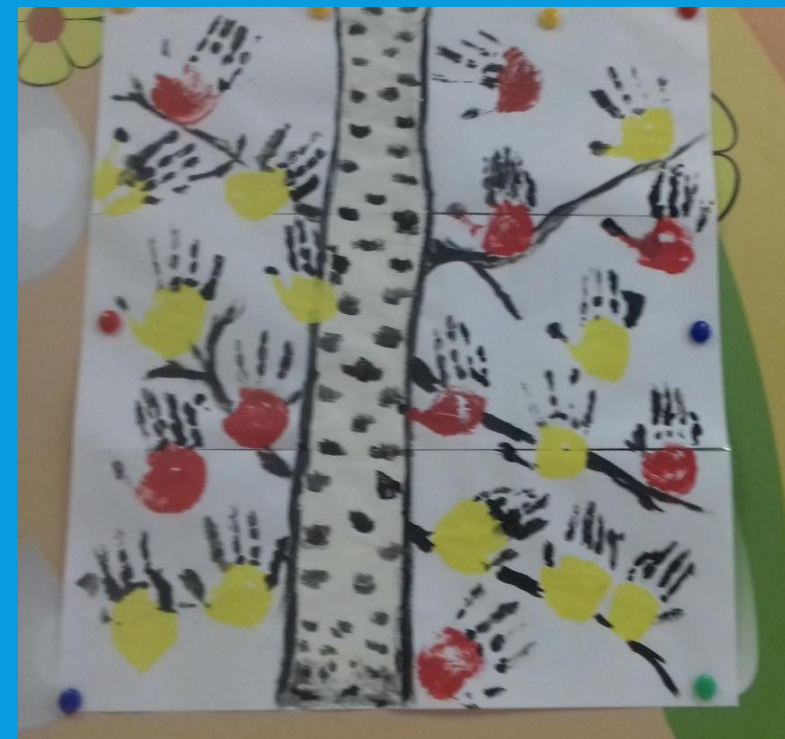
Рисование «Зимующие птицы»