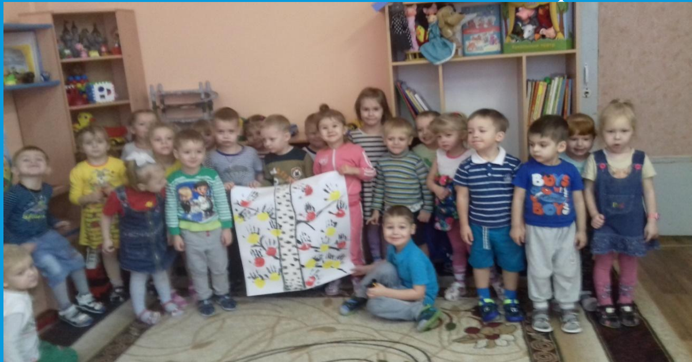
Рисование ладошка «Птички на дереве»