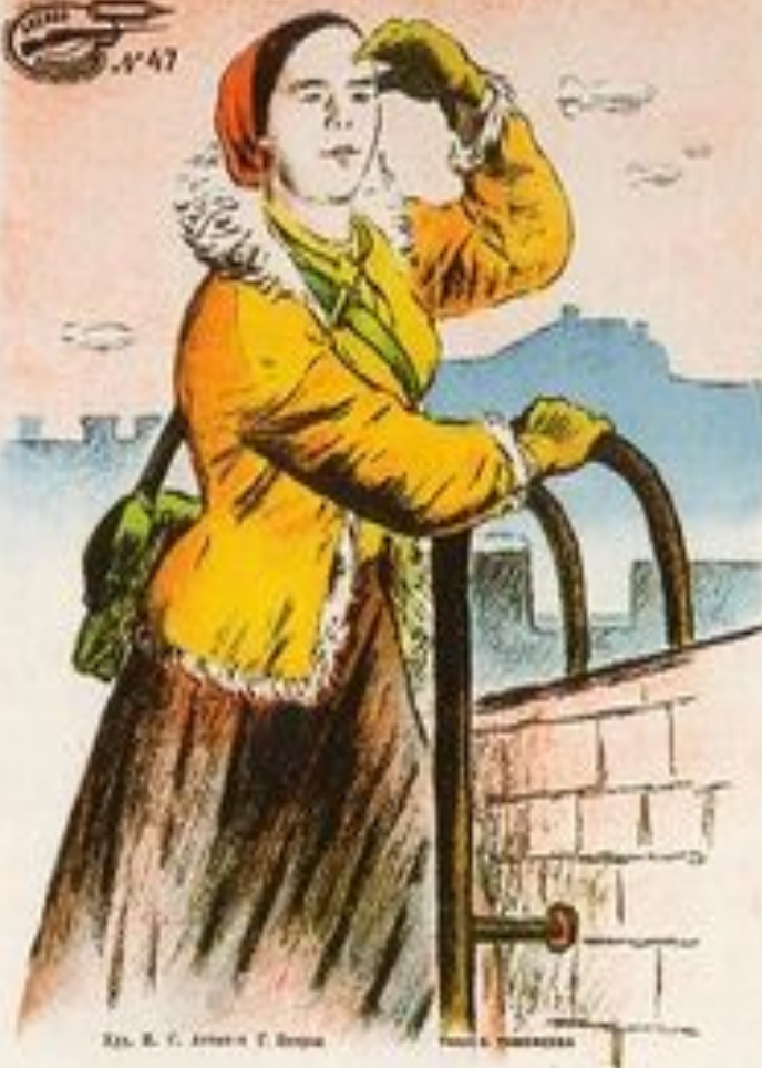
Худ. В. С. Арнольд. Т. Ворон