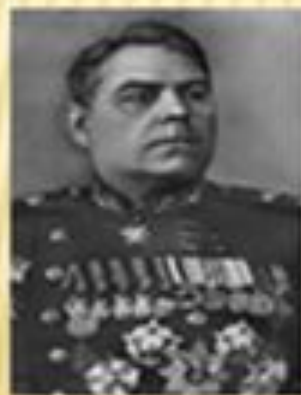
Василевский А.М. представитель Ставки