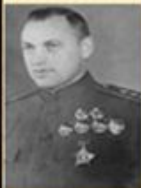
Рокоссовский К.К. командующий Центральным фронтом