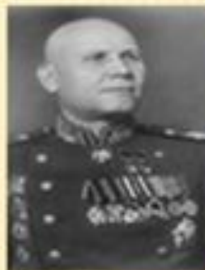
Конеv И. С. командующий Степным фронтом