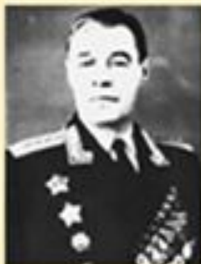
Попов М. М. командующий Брянским фронтом