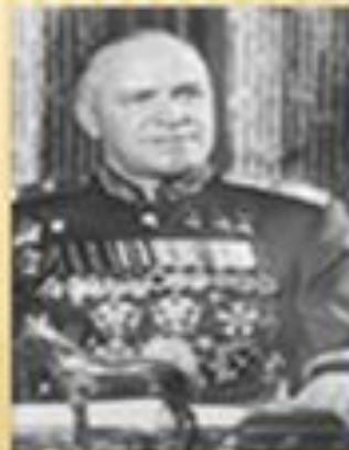
Жуков Г.К. представитель Ставки