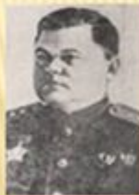
Ватутин Н. Ф. командующий Воронежским фронтом.