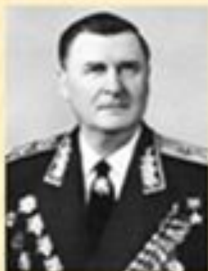
Соколовский В. Д. командующий Западным фронтом