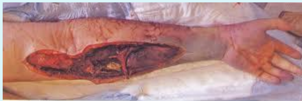
Рис. 3. Газовая гангрена левой верхней конечности после введения "Коаксила" в кубитальную вену.