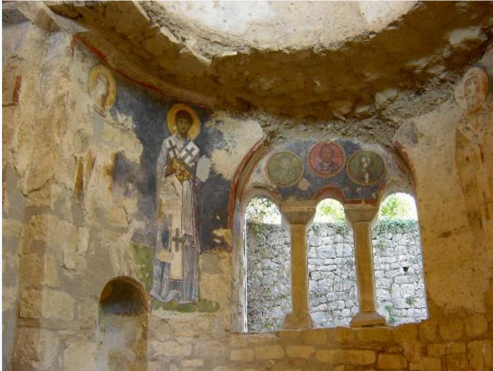
* Церковь Святого Николая в Демре