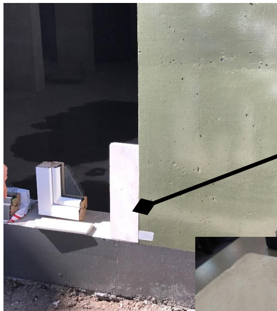
камень RAL 9002.