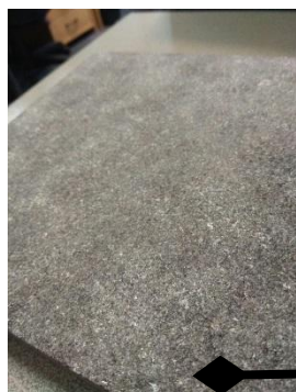
Гранит RAL 7039