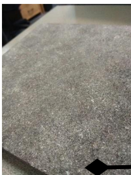
Гранит RAL 7039