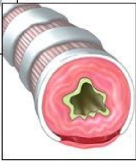
Бронхиальная трубка при бронхиальной астме