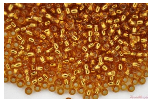
Прозрачный бисер с золотой нитью внутри