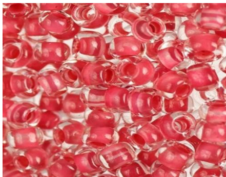
Прозрачный, покращенный внутри