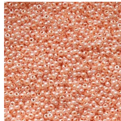
Обливной или мокрый