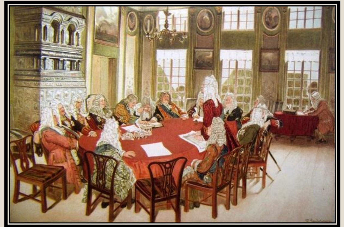
Сенат при Петре I