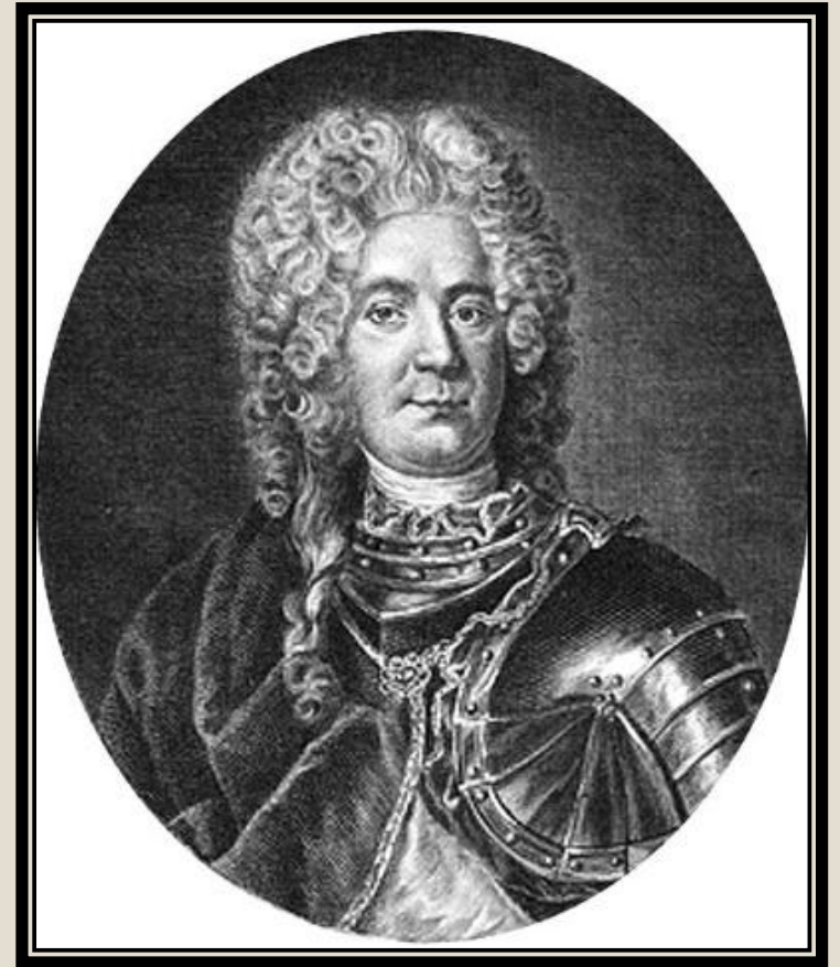
Павел Иванович Ягужинский «Око Государево»