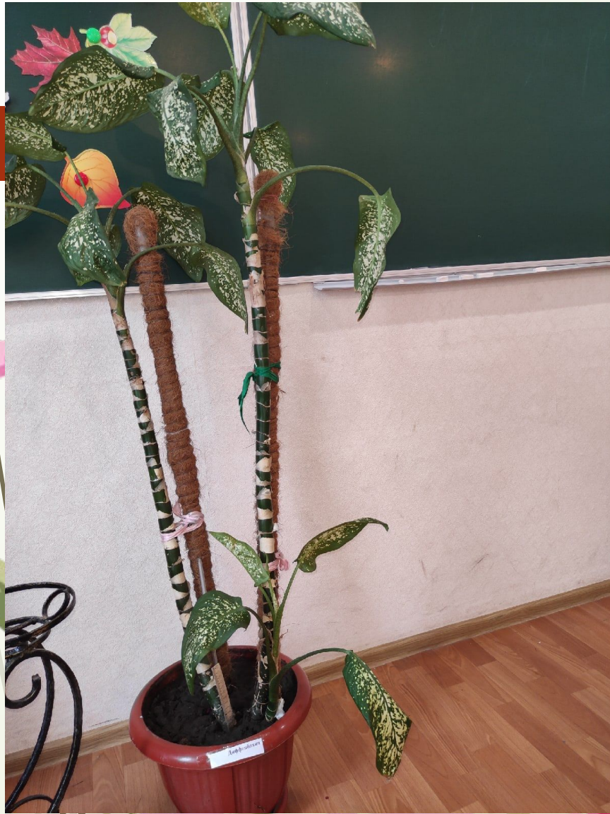
Диффенбахия (лат. Dieffenbachia ) — род вечнозелёных растений семейства Ароидные ( Araceae ) распространённых в тропиках Южной и Северной Америки.