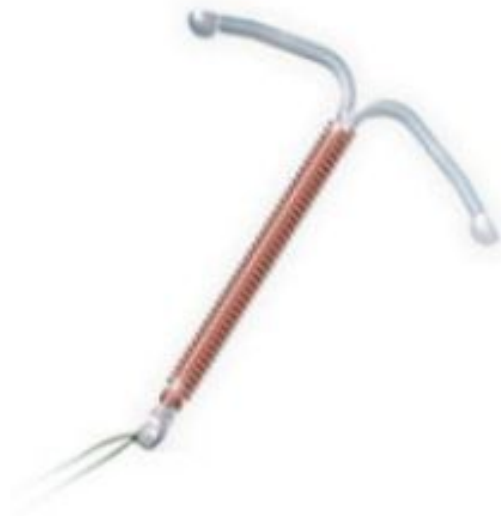
Т - ОБРАЗНАЯ