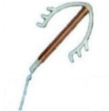
Ф - ОБРАЗНАЯ