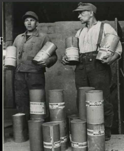
Баллоны с газом «Циклон»