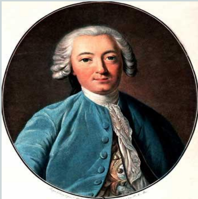
Французский философ-просветитель К.А.Гельвеций (XVIII век)

«Всякий, в сущности, всегда повинуется интересу... Личный интерес есть единственная и всеобщая мера человеческих поступков».