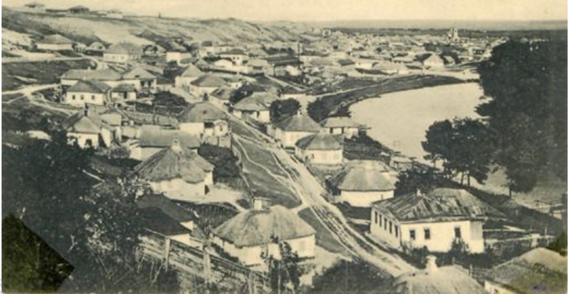
Г. Валуйки Видъ на Поднизовку и Казанскую