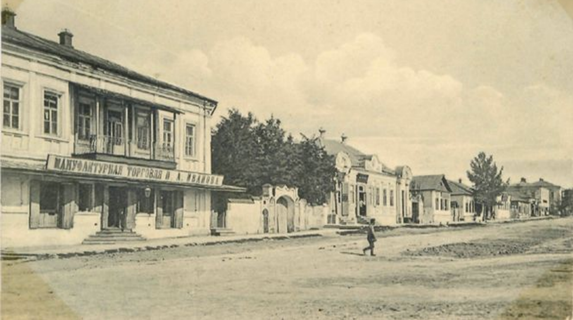
Г. Валуйки Купи́нская улица